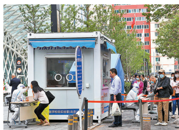
◆6月13日，民眾在北京市朝陽區一處核酸檢測點進行採樣。

孫春蘭指出，要進一步加強市級統籌，指揮體系扁平化，切實做到刻不容緩、以快制快。針對疫情形勢的發展變化，及時動態調整相關防控措施，關鍵在抓細抓實重點區域防控，科學判定和管控出現感染者的社區，徹底阻斷傳播途徑。要做到應檢盡檢、應隔盡隔，依靠社區網絡化管理做好組織動員工作，確保不漏一人。要強化核酸檢測全流程監管，加強現場採樣的培訓指導和監督評估，切實提高核酸採樣和檢測質量。要深入細緻做好流調溯源和排查，「三公（工）」人員形成專班、密切協同，盡快理清傳播鏈條，鎖定疫情爆發源頭，及時堵住漏洞。要加強重點場所防務，對人員密集、環境密閉的行業逐一評估風險隱患，穩妥安全推動放開，恢復生產生活秩序。