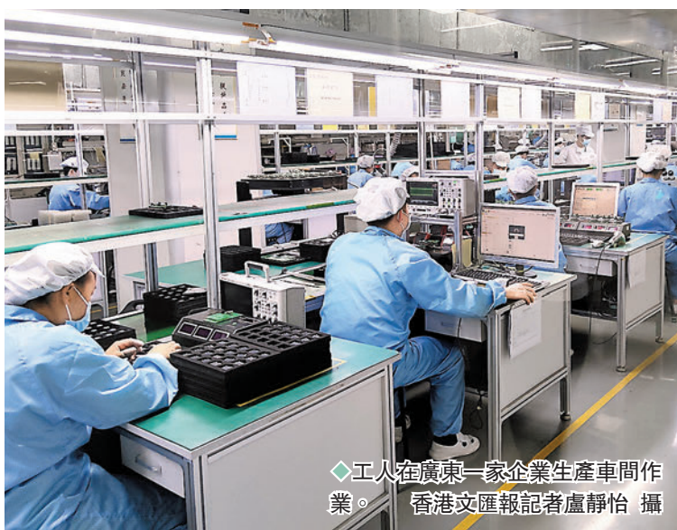
◆工人在廣東一家企業生產車間作業。

談及目前「一核一帶一區」不同產業的發展，朱偉介紹，珠三角核心區創新驅動、示範帶動態勢正在凸顯。「珠三角核心區優質資源、高端產業進一步集聚，新動能、新優勢加快培育，已經邁上高質量發展快車道，對全省的輻射帶動作用也正在日益增強，有力支撐廣東區域創新綜合能力連續5年穩居全國首位。」他表示，一批關鍵核心技术「卡脖子」問題正在得到破解，廣東在人工智能、超高清視頻等領域培育形成了一批新興產業集群。