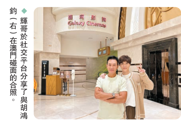
◆輝哥於社交平台分享了與胡鴻鈞(右)在澳門碰面的合照。

香港文匯報訊(記者 阿祖)張兆輝近月來都留在內地工作，近日他身處澳門，竟有緣遇上「兒子」胡鴻鈞，兩「父子」重聚，當然要食餐飯碰杯慶祝一下！輝哥近日於社交平台分享了與胡鴻鈞在澳門碰面的合照，並留言：「改天是哪天？下次是哪次？以後是多久？疫情改變了很多人的緣分，有緣分做父子，就有緣分再見面！」其實二人是在本月23日公映的慶祝回歸25周年電影《一樣的天空》，其中一個單元《乘風破浪》中合演父子，戲中輝哥愛子之心被胡鴻鈞一直誤解，但最後仍能化解，當中描寫的父子情甚為感人。輝哥也表示：「這對父子相遇在澳門，大家記得23號入場支持我們的電影！」