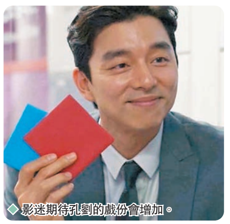
◆影迷期待孔劉的戲份會增加。