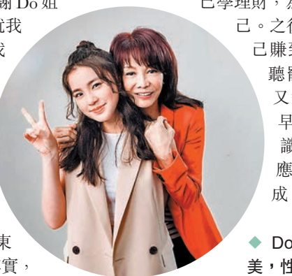
◆Do姐大讚姚焯菲樣子甜美，性格乖巧。

拍攝期間，Do姐問到Chantel未夠18歲資格領取消費券，會否要求父母共享他們的消費券買東西給她，Chantel說：「其實，