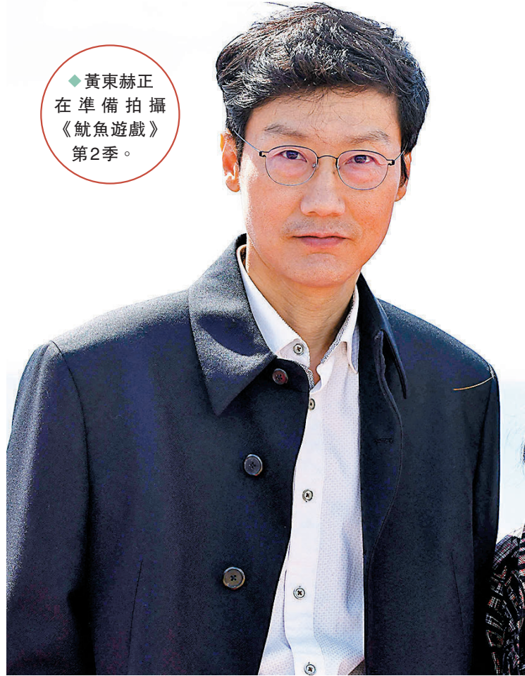
◆黃東赫正在準備拍攝《魷魚遊戲》第2季。