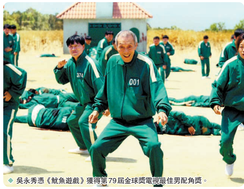
◆吳永秀憑《魷魚遊戲》獲得第79屆金球獎電視最佳男配角獎。