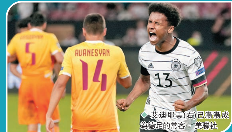
艾迪耶美(右)已漸漸成為德定的常客。