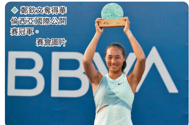
◆鄭欽文奪得華倫西亞國際公開賽冠軍。賽會圖片

雖然在單打世界排名下降13位到第54位，但張帥在雙打賽場頗有斬獲，在WTA250諾定成網球賽，雙打頭號種子中國的張帥與巴西的瑪雅雅組合，以7:6(2)和6:3擊敗多勒希德/尼庫萊斯庫組合，獲得女雙桂冠。「非常開心能夠再次回到諾定成並拿到冠軍。這裏有很多非常好的回憶，能夠奪冠對我來說很有意義。」張帥說。這是張帥職業生涯第12個巡迴賽雙打頭銜，也是第一個草地雙打冠軍。