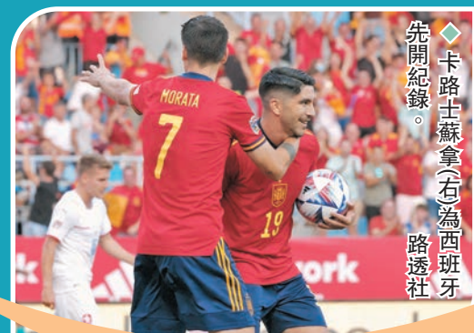
◆卡路士蘇拿(右)為西班牙先開紀錄。

葡萄牙隊主帥費蘭度山度士指出，早早失球打亂了球隊的部署，「我們不能夠開賽僅過半分鐘就失守的，那是我們犯的錯。」