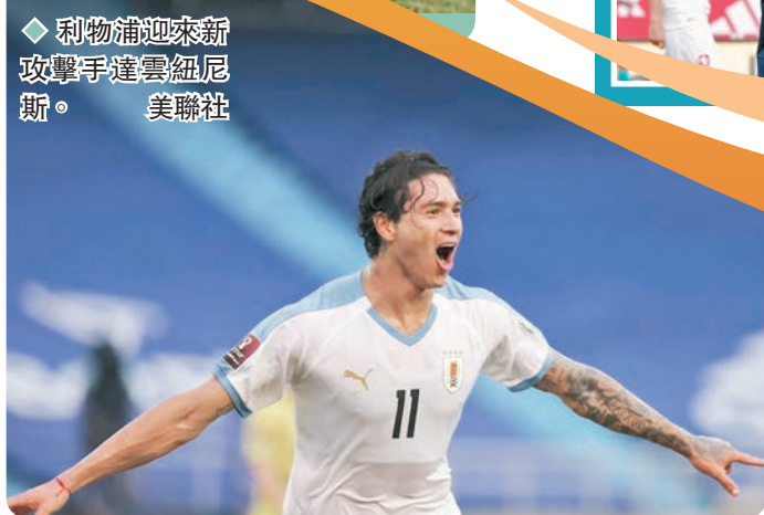
◆利物浦迎來新攻擊手達雲紐斯。

另一支英超超標勁旅利物浦亦迎新援，葡超賓菲加昨日向葡萄牙證監會通報了前鋒達雲紐斯轉會利物浦的消息，並確認該筆交易基礎轉會費為7,500萬歐元，加上若干附加條款最高可達1億歐元。將滿23歲的達雲紐斯剛過去賽季41場比賽為賓菲加攻入34球，榮膺葡超最佳射手。