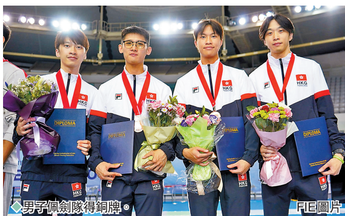
◆男子佩劍隊得銅牌。