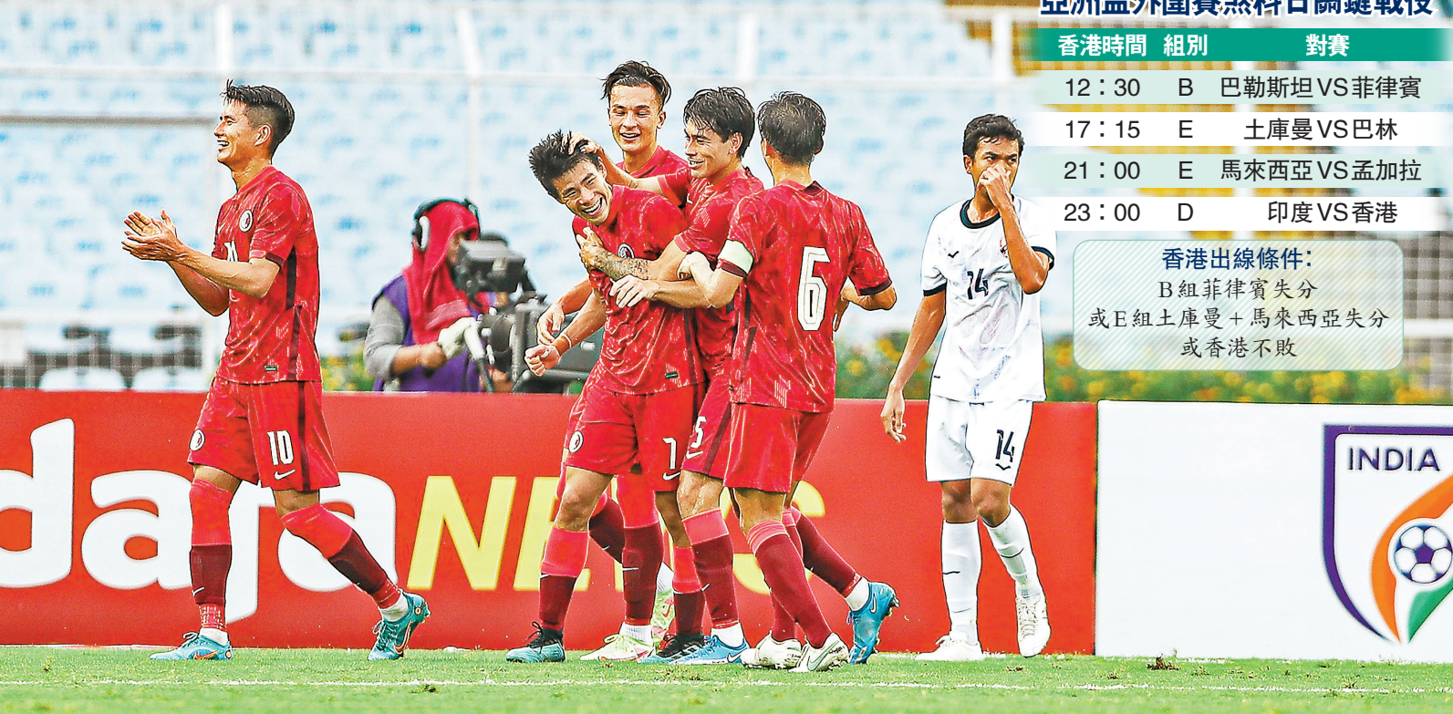
◆港足距離晉級只差一步。