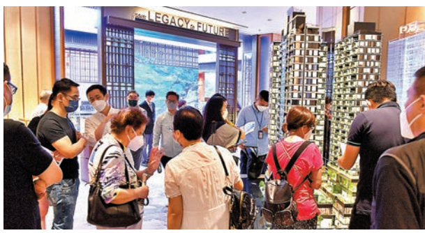
◆必嘉坊·曦匯累收超過1,000票，以三張價單182伙計，超額認購約4.5倍。