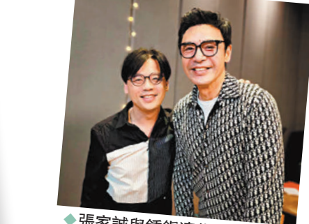
◆張家誠與鍾鎮濤錄製《前》。