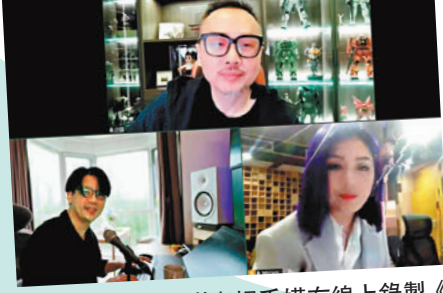
◆張家誠、陳少琪與楊千嬅在線上錄製《前》。