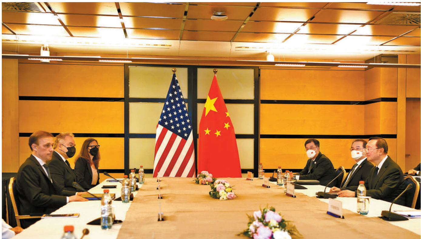
◆6月13日，中共中央政治局委員、中央外事工作委員會辦公室主任楊潔篪（右一）同美國總統國家安全事務助理沙利文（左一）在盧森堡舉行會晤。

楊潔篪強調，美方理應與中方良性互動，為亞太地區繁榮、穩定和發展作出共同努力。雙方還就烏克蘭、朝核等國際地區問題交換意見。