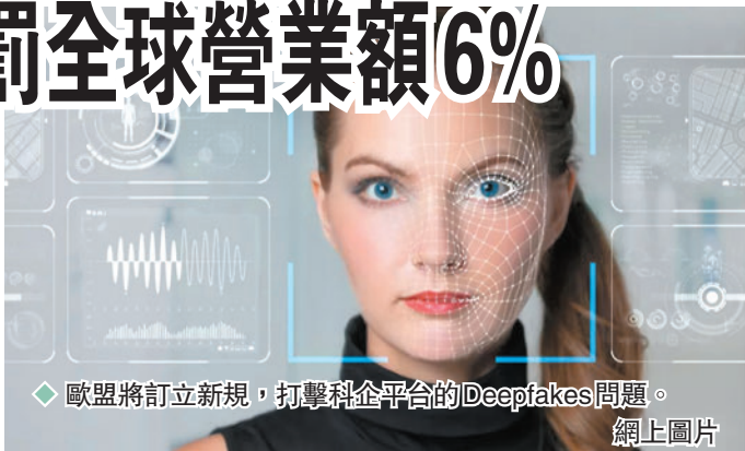
◆歐盟將訂立新規，打擊科企平台的Deepfakes問題。