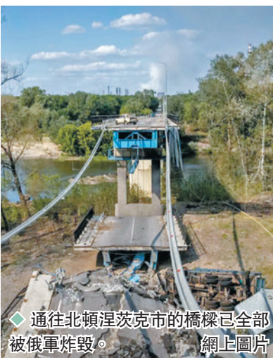
◆通往北頓涅茨克市的橋樑已全部被俄軍炸毀。 網上圖片