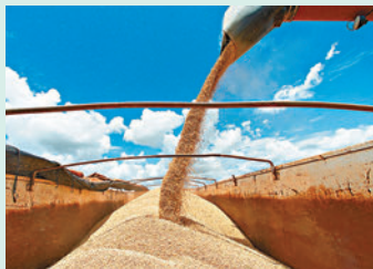
◆全球糧食危機持續，大豆價格錄得新高。