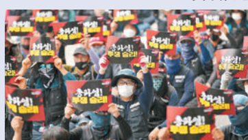
◆韓國貨車司機在光州一座工廠外示威。