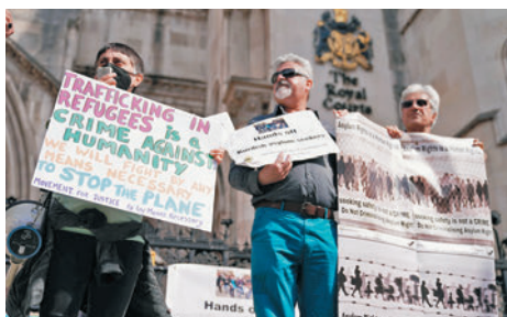
◆倫敦有示威者在最高法院外集會，抗議英國政府將難民遣送盧旺達。