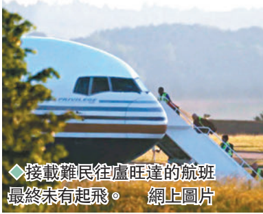
◆接載難民往盧旺達的航班最終未有起飛。