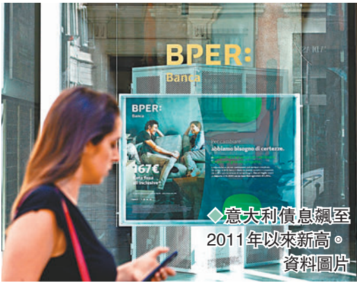
◆意大利債息飆至2011年以來新高。資料圖片