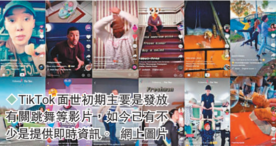
◆TikTok面世初期主要是發放有關跳舞等影片，如今已有不少是提供即時資訊。網上圖片