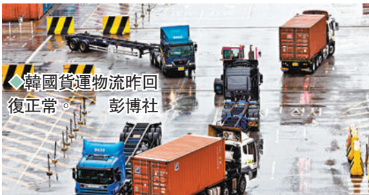
◆韓國貨運物流昨回復正常。

今次大罷工對韓國造成嚴重損失，根據該國產業通商資源部的統計數據，汽車、鋼鐵、石化、水泥等主要行業的生產、出貨及出口，損失共達12億美元（約94億港元）。◆綜合報道