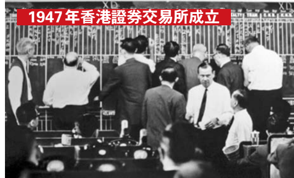
1947年香港證券交易所成立