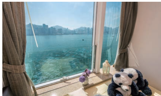
◆ 酒店採用每戶獨立冷氣系統，套房窗戶更可自由開關，令空氣流通，較一般酒店優勝，有助減低病毒潛伏的風險。

長江實業(01113)旗下 Horizon Hotels & Suites 營運的4間酒店，包括紅磡海灣軒及海韻軒、馬鞍山海澄軒、葵涌雍澄軒，以創新「Famitel Living 酒店+居」概念營運的酒店，並長期關注加強防疫清潔工作和措施，加上採用每戶獨立冷氣系統，套房窗戶更可自由開關，令空氣流通，較一般酒店優勝，有助減低病毒潛伏的風險。