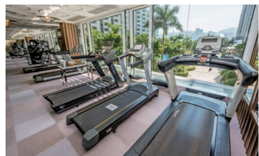
◆ 住客會所更附設健身中心等星級酒店的高品質配套。