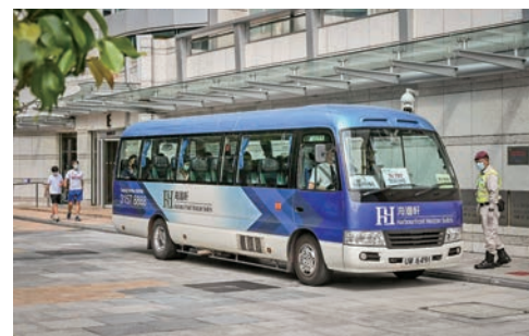
◆ 長實旗下 Horizon Hotels & Suites 營運的4間酒店，包括紅磡海灣軒及海韻軒、馬鞍山海澄軒、葵涌雍澄軒，以創新「Famitel Living 酒店+居」概念營運。

休閒空間是酒店生活的一部分，家在酒店也可滿載舒適溫馨，兼可體驗酒店級享樂設施，每天的生活媲美度假享受。Horizon Hotels & Suites 所有套房均採用家居式設計，酒店從「家居」的角度出發，感受如家般的酒店生活，是 Family 更是 Hotel。這就是品牌旗下創新的「Famitel Living 酒店+居」概念，基於住客的核心需求，精研於居住空間的品質塑造。所有套房均採用家居式設計，建面約 600 餘呎起的 2 房 2 廳，為客人提供一份舒適空間。房間內各種家電一應俱全，提供超過 50 個電視頻道，能夠盡覽世界各地的精彩節目，縱享窗外觀海景、窗內看世界的優質體驗，此外，還有備餐間、獨立冷氣系統等高級配置，讓住在酒店也能享受家一般的溫馨和舒適，尊享一份度假般的酒店生活新體驗。