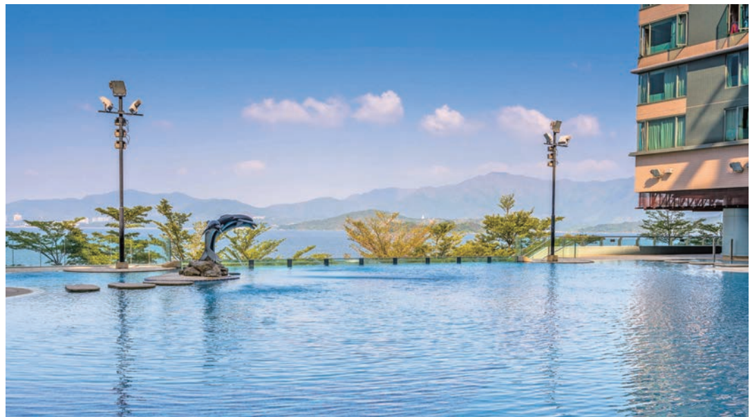
◆ 4 間酒店內均設有住客會所，住客足不出戶就能享受露天泳池悠閒。

Horizon Hotels & Suites 既擁有酒店的星級服務品質，又兼具「家