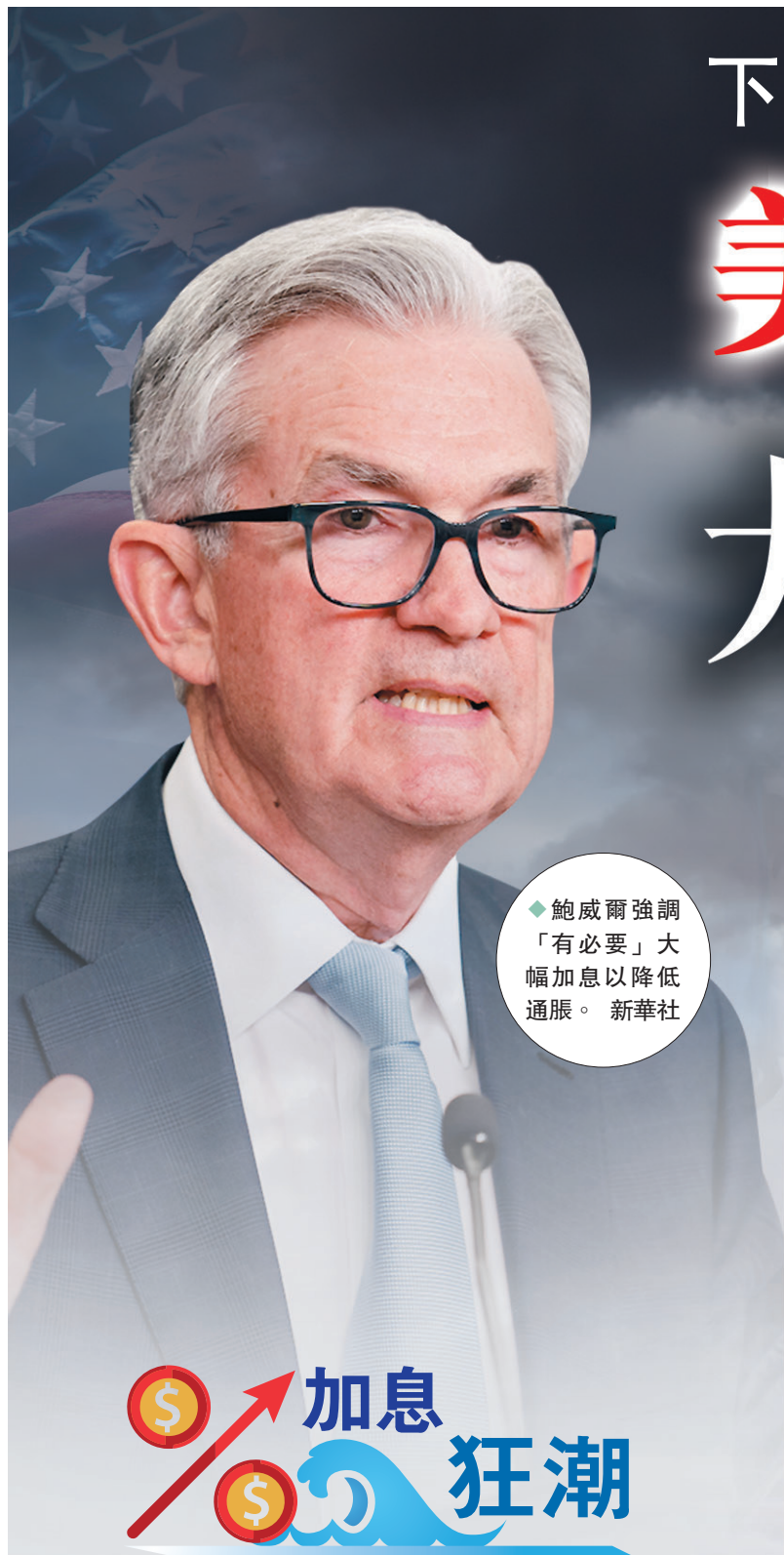
鮑威爾強調「有必要」大幅加息以降低通脹。