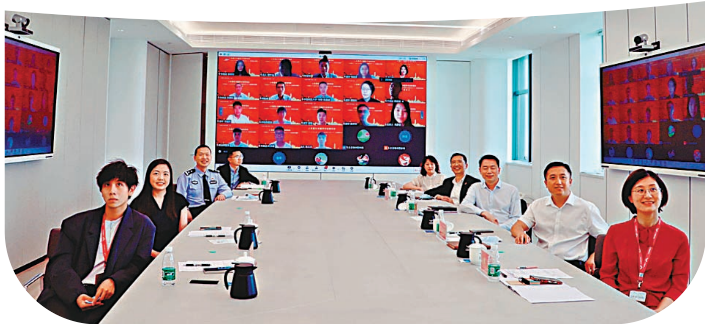
◀「慶祝香港回歸祖國25周年 讓青春在中國夢中綻放異彩」座談會現場。

香港文匯報訊(記者 朱燁 北京報道)由中央政府駐港聯絡辦北京聯絡部和北京市青年聯合會共同主辦的「慶祝香港回歸祖國25周年 讓青春在中國夢中綻放異彩」座談會17日在京舉行,多位香港青年分享了在內地多年的追夢故事。他們棄商從政駐村掛職,他們「從零到一」北上創業,他們尋根內地演藝夢,他們帶着一腔熱情在內地廣闊的舞台上打拚,在新時代新天地中施展抱負。他們紛紛表示,年輕人追夢應追家國夢,立志當立天下志,願背靠祖國向陽而生。