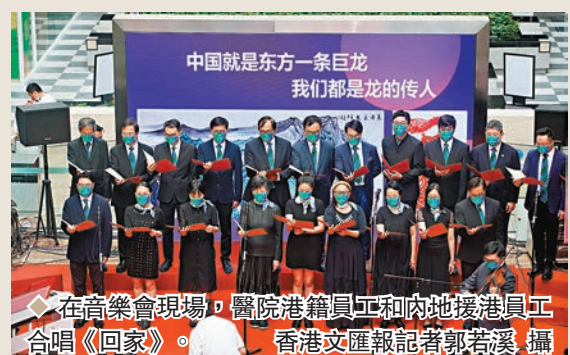
在音樂會現場,醫院港籍員工和內地援港員工合唱《回家》。

值,倡導公益優先」一直是香港大學深圳醫院堅持的理念。十年來,香港大學深圳醫院陪伴市民和病友成長,留下許多美好的故事。音樂會上,一群天真爛漫的、活潑可愛的小朋友們演唱了《你笑起來真好看》,其中領唱的小妹妹強妹(小名),是在港大深圳醫院出生的早產兒,她和許多在港大深圳醫院出生的小朋友一樣,對醫院懷着特殊的感情。