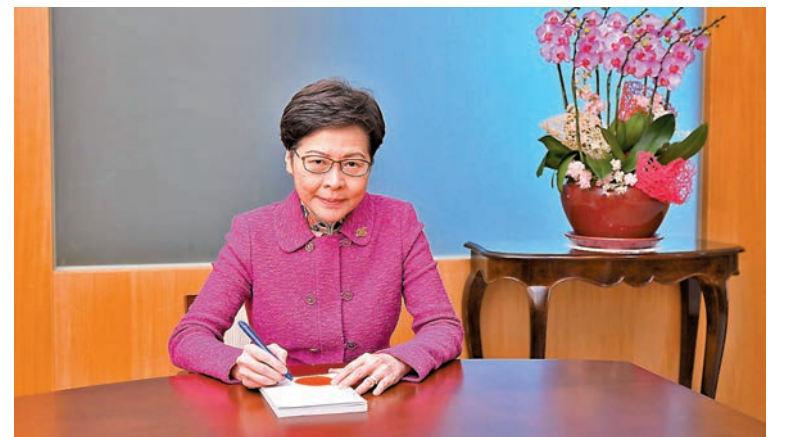
◆林鄭月娥簽署《2022年僱傭及退休計劃法例(抵銷安排)(修訂)條例》。

取消「對沖」安排不具追溯力，如僱員在修訂條例生效日期(轉制日)之前已受僱，僱主可繼續用其強積金供款累算權益，「對沖」僱員在轉制日前的受僱期所產生的遣散費及長服金。取消「對沖」安排將同樣適用於《職業退休計劃條例》(第426章)下的職業退休計劃、《補助學校公積金規則》(第279C章) / 《津貼學校公積金規則》(第279D章)的兩類學校公積金計劃，以及獲豁免於強積金計劃的外地僱員所參加的海外職業退休計劃。