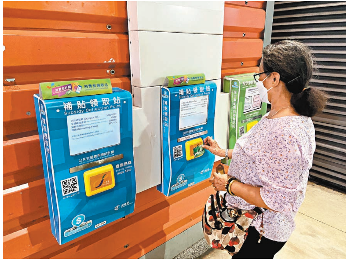
◆不少市民消費「未達標」，結果於前日及昨日均未能領取餘下1,000元消費券。圖為市民領取消費券。

八達通在回覆傳媒查詢時表示，已處理逾千宗不同類型的查詢，政府亦已向超過200萬名合資格市民發出短訊通知有餘下1,000元消費券金額。由於有超過400萬名市民登記使用八達通領取消費券，即至今仍約有200萬人未能領取餘下的1,000元消費券金額。