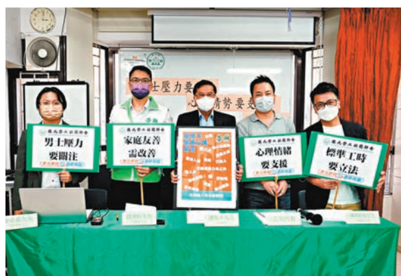
◆勞聯針對疫情期間本港父親們所承擔的壓力，發起「疫情下爸爸們壓力問卷調查」。