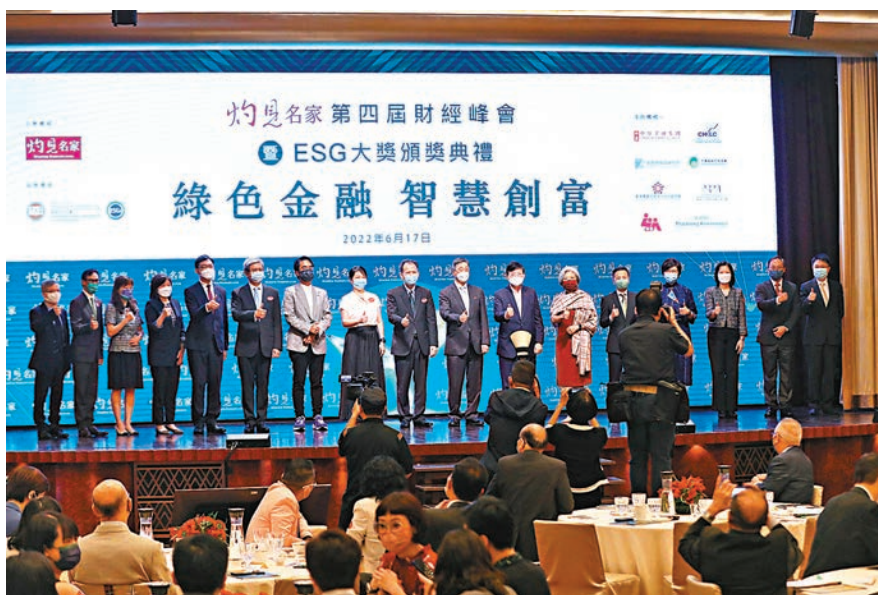
◆由灼見名家主辦的灼見名家第四屆財經峰會暨ESG大獎頒獎典禮昨日舉行，活動以「綠色金融 智慧創富」為主題。

則表示，特區政府今年首次發行零售綠色債券，令普通市民都可以參與發展綠色經濟。特區政府在推動綠色金融的其中一個目標，是加強企業披露他們在綠色方面的工作，以及支持金融業界，包括銀行、證券、保險等行業，強化他們在綠色方面的認識，以及滿足監管機構的要求。