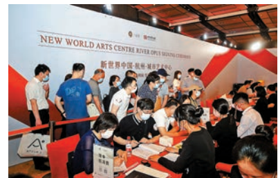
◆「新世界·城市藝術中心」首輪開售認購。

新世界發展資料顯示，「新世界·城市藝術中心」位於西湖和錢塘江之間的望江新城。項目由普利茲克建築獎得主坂茂(Shigeru Ban)，以及英國皇家建築師協會銀獎得主奧勒·舍人(Ole Scheeren)參與建築設計。城市藝術中心設計上汲取西湖、錢塘江、八卦田等杭州代表元素，與城市形成歷史人文共鳴。項目融合圍繞交通、工作、居住及商業進行一體化設計，打造「文化藝術愛好者聚集地」、「縱向創意城市」、「可居住的美術館」等地標。