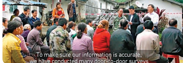
To make sure our information is accurate, we have conducted many door-to-door surveys