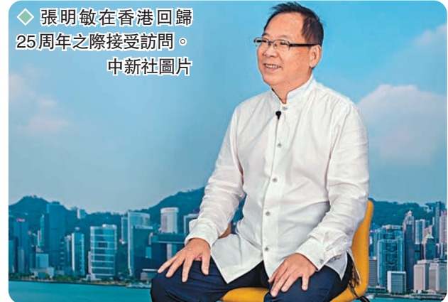
◆張明敏在香港回歸25周年之際接受訪問。

「《我的中國心》不是屬於我個人的，屬於全世界的華僑華人。『我的中國心』就是如何讓中國更好，讓『一國兩制』在香港行穩致遠，給世界上的人都看到我們中國的面貌。」張明敏說着，稍作停頓，又重複說：「這就是『我的中國心』。」