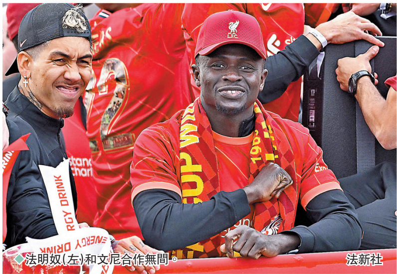
法明奴(左)和文尼合作無間。