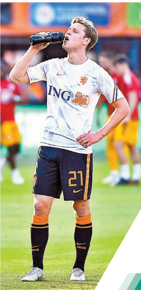
◆迪莊在巴塞前途仍未明朗。

人」，由於至今仍未為球隊完成任何一單收購和賣人，已引起大量曼聯球迷的不滿。消息指，梅度夫希望一改球隊過往的「水魚」形象，希望展露出強硬的態度，但他的小心態度，卻似乎令到球會目標逐一流失。最新消息指，近日和曼聯傳出「緋聞」的波圖中場域天拿，已被巴黎聖日耳門截劫成功，聖日耳門已觸發這位葡萄牙中場的4,000萬歐元合約條款，相信很快便可官宣加盟，至於曼聯在再失一位目標下，梅度夫壓力肯定越來越大，昨日甚至有報道指坦哈格已對梅度夫等人的表現感到沮喪，對急需重建的曼聯自然並非好事。