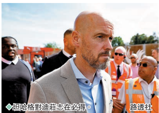
◆坦哈格對迪莊志在必得。

香港文匯報訊（記者 楊浩然）據歐洲多位著名體育記者報道，曼聯新領隊坦哈格對巴塞中場法蘭基迪莊志在必得，無論如何也要把這位前阿積士舊部帶到奧脫福，因此已要求負責談判的高層加緊收購速度，而球會據報亦已把收購金額由6,000萬歐元+浮動條款，變成7,000萬歐元+浮動條款，但據報仍會被巴塞拒絕。