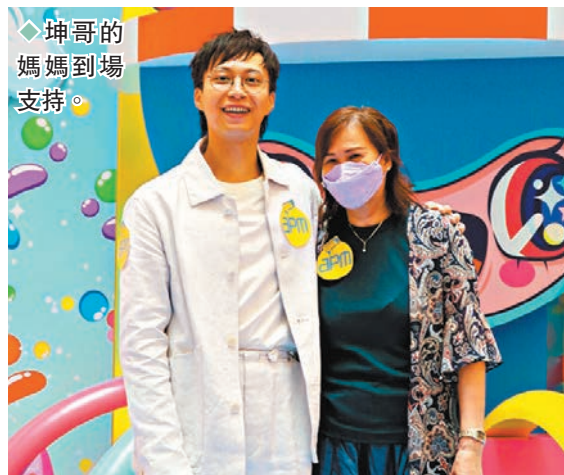
◆坤哥的媽媽到場支持。