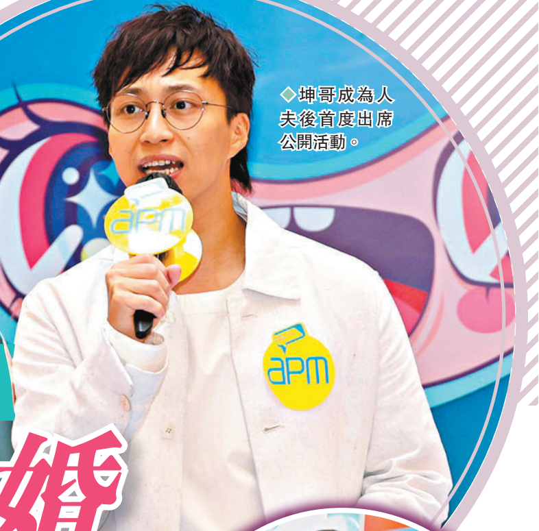
◆坤哥成為人夫後首度出席公開活動。