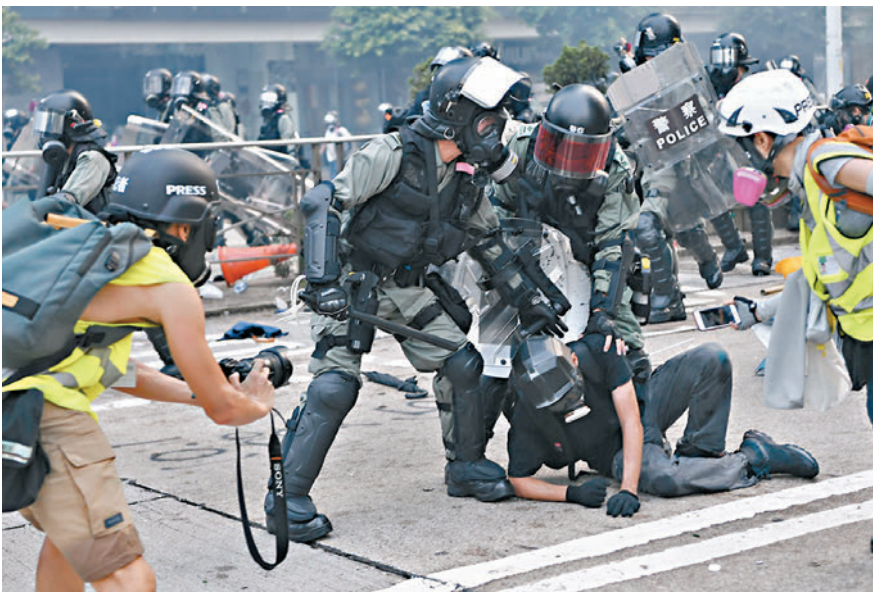
◆圖為2019年9月29日大批黑暴包圍政總，防暴警嚴正執法拘捕多人。資料圖片

對於被告自稱當日只是「旁觀者」，法官形容他是「自欺欺人、掩耳盜鈴」，因為當日磚塊橫飛、交通停頓，「任何人都會感到暴風雨情況、觸目驚心的氛圍，沒有人會以為是嘉年華。」當日被告手上沒有樂器和樂譜，卻攜帶頭盔、護臂、防毒面具、手套及電筒等重裝備，被捕前