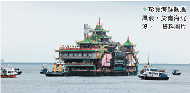
◆珍寶海鮮舫遇風浪，於南海沉沒。資料圖片

事工程人員詳細檢查船身和加上圍板，並得到一切所需批文進行本次航行。過去46年，珍寶海鮮舫佇立港島南區，成為居民及旅客駐足注目的獨特地標，是港人集體回憶。自2020年3月3日起，珍寶海鮮舫因新冠疫情暫停營業，其海事牌照於今年6月到期。