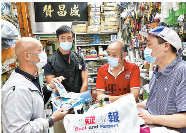
◆警方及消防人員到五金店派發宣傳單張，提升業界安全意識及保安意識。

香港文匯報訊(記者 蕭景源)跨部門反恐專責組「反恐舉報熱線」推出一個多星期，已經接獲逾1,600條舉報信息。為更有效打擊愈趨地下化的極端分子爆炸品案件，反恐專責組於本月正式展開「安全社區、承諾」計劃，首階段主要針對化學品原材料相關業界，重點提升五金店、化學品原材料零售點的保安意識，加強警方與業界之間聯繫，配合「全民反恐、見疑即報」的反恐策略，聯手防範極端分子利用化學品材料危害社會安全。