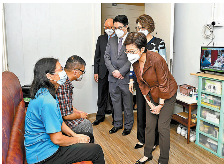
◆林鄭月娥昨日在運輸及房屋局局長陳帆等人陪同下到元朗過渡性房屋項目「博愛江夏圍村」，探訪其中一戶家庭，了解他們的生活情況。

另外，房委會發言人昨日表示，2021/22年度的實際編配數字為25,955個，佔原先估算83.7%，數目出現落差主要因為第五波疫情嚴峻，政府曾徵用粉嶺皇后山邨第一座和第七座，以及葵涌荔景邨恒景樓作社區隔離設施。2022/23年度估算約有27,600個單位，包括約12,500個新單位及約15,100個翻新單位可供編配予各類別申請者，當中73.2%將編配予公屋申請者。發言人表示，有關估算數字並非上限，若有任何新公屋提前竣工，會盡快將相關公屋單位編配予申請者。