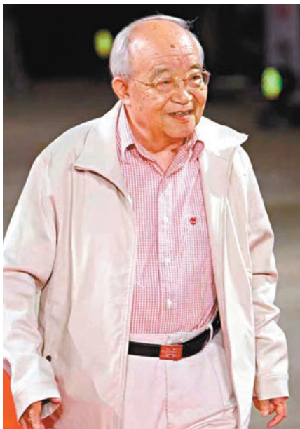
◆《我的祖國》詞作者喬羽。