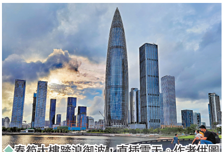
春筍大樓踏浪御波，直插雲天。