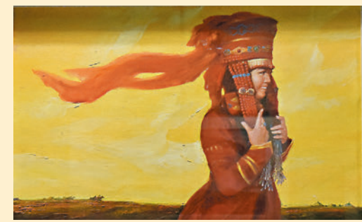
◆ 油畫作品《鄂爾多斯新娘》。