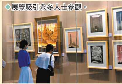
◆ 展覽吸引眾多人士參觀。

過戈沙先生的作品，配合一系列輔助陳列，在展現戈沙藝術創作和藝術成就的同時，亦大視角展現了絲綢之路的自然風光、人文內涵以及精神意蘊。