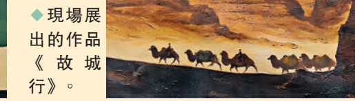
◆ 現場展出的作品《故城行》。

《黃河行》《大漠枯林》《紅柳》《生命之歌》，均是以這些平凡生活和美麗自然中最常見的景象作為創作之本，然後通過畫家的自我感受和繪畫技法，創造出一種「人化的自然」，在視覺震撼中引人深思。