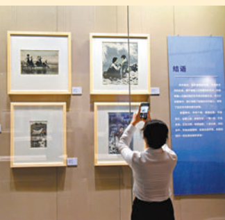
◆ 觀眾紛紛用手機記錄戈沙作品。