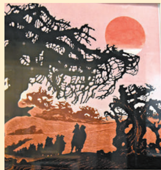
◆ 現場展出的版畫作品《大漠枯林》。

「塞沙茫茫出關道，駱駝夜吼黃雲老。」駱駝、胡楊林和紅柳是西北和絲綢之路的標誌，同時也是戈沙作品中最經典的創作對象。此次展覽展出的版畫作品《石壁行》《火焰山》