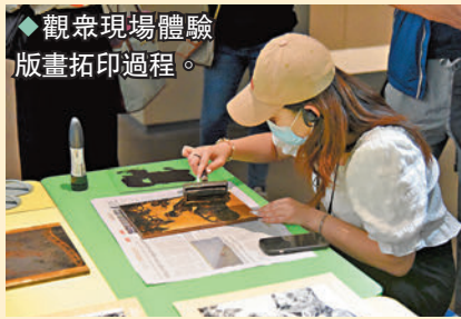
◆ 觀眾現場體驗版畫拓印過程。