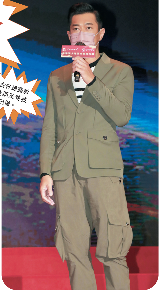
古仔透露影片後期及特技會自己做。