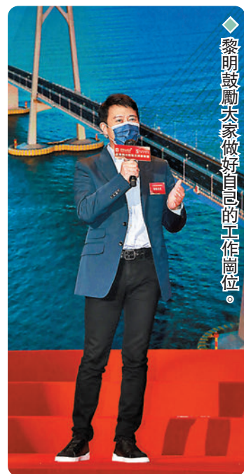
黎明鼓勵大家做好自己的工作崗位。

樣的狀況，真的只有感到無比的傷心和遺憾。」於是決定查清事實，並直接硬起來提告；另外，也將針對惡意留言採取強硬手段。