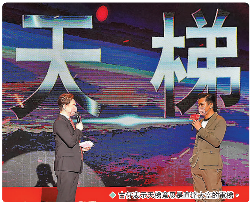
古仔表示天梯意思是直達太空的電梯。