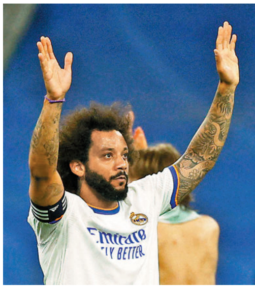
馬些路是皇馬15年忠臣。

至於來季升班西甲的最後一個席位亦已於香港時間昨日凌晨誕生，西乙第6名取得最後一個附加賽權的基羅納，準決賽淘汰第3名伊巴後再於昨日決賽3:1贏第5的特內里費，可隨西乙冠軍艾美利亞和華拉度列升班，時隔3年重回西甲。