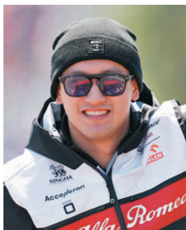
第八名是周冠宇迄今F1最佳成績。