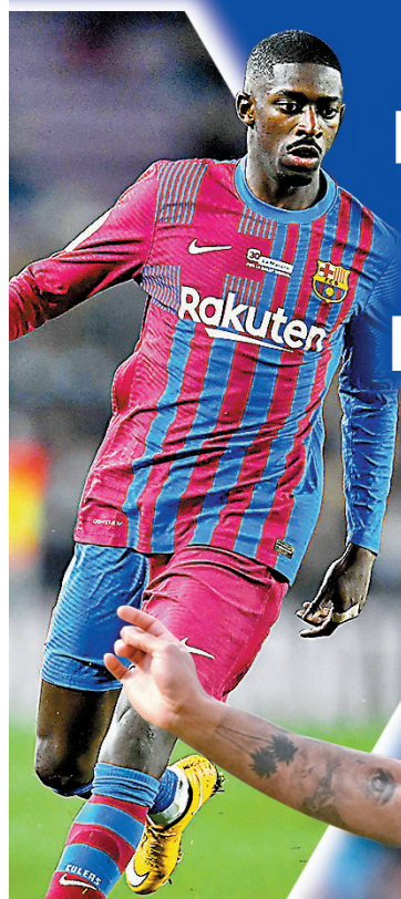
奧斯文尼迪比利雖然好波，但受傷的密度實在令人憂慮。