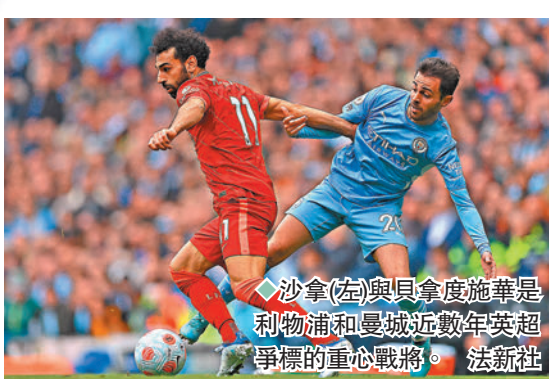
沙拿(左)與貝拿度施華是利物浦和曼城近數年英超爭標的重心戰將。

香港文匯報訊（記者 梁志達）英超雙雄利物浦與曼城都分別要面臨各自隊中主將穆罕默德沙拿及貝拿度施華隨時離隊的可能，至於另