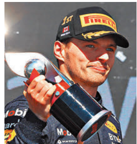
韋斯達賓再奪一站冠軍。

九站比賽過後，韋斯達賓175分領跑車手積分榜，佩雷斯129分名列第二，勒克萊126分緊隨其後。周冠宇積5分在20名車手中排在第16位。下一站英國大獎賽正賽將於7月3日進行。