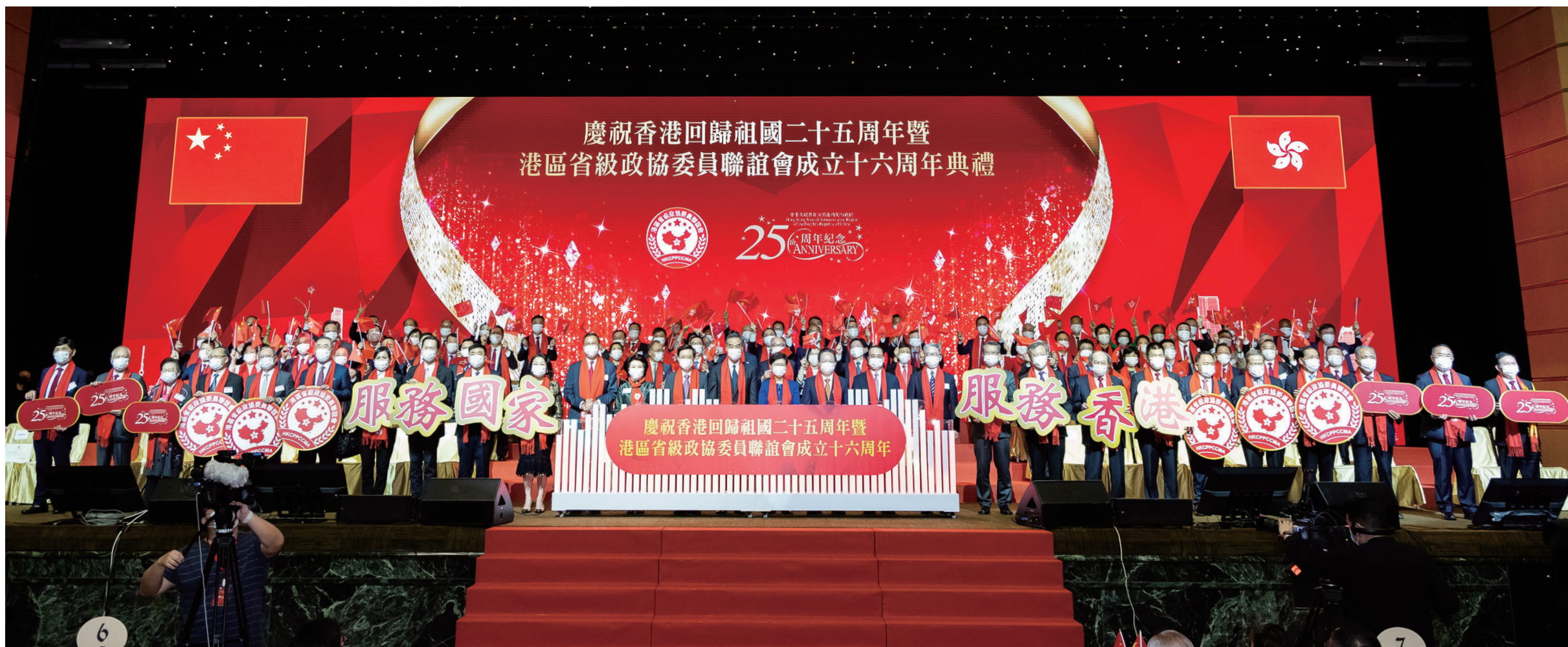
▲港區省級政協委員聯誼會慶祝香港回歸祖國25周年暨會慶16周年圓滿舉行。