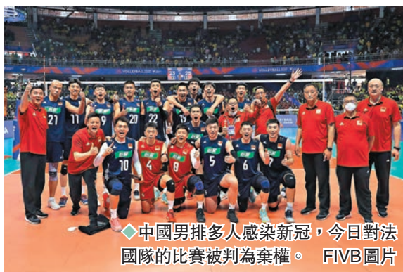
◆中國男排多人感染新冠，今日對法國隊的比賽被判棄權。

據賽事組委會關於「確診陽性運動員須隔離滿5天」的規定，中國男排無法湊齊至少6名上場運動員參加原定於香港時間今日15時舉行的對陣法國隊的比賽，中國隊被視為棄權，被判0:3告負。