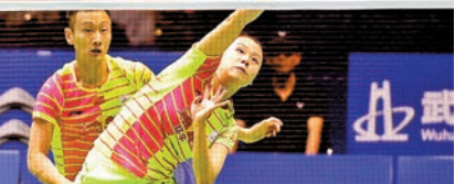
◆趙芸蕾(右)16年曲戰亞錦賽。資料圖片

香港時間6月21日，世界羽毛球聯合會公布了2022年名人堂名單。中國羽毛球雙打名將、倫敦奧運會女雙混雙金牌得主趙芸蕾入選。趙芸蕾在職業生涯中共獲得2枚奧運金牌、5枚世錦賽金牌、與隊友一起3次捧起蘇迪曼盃、3次捧起優霸盃，共獲13次世界冠軍。值得一提的是，趙芸蕾在倫敦奧運會和兩屆世錦賽上取得了「雙冠王」，是唯一在一屆奧運會上拿到兩枚金牌的羽毛球運動員，也是唯一連續兩屆世錦賽獲得兩個雙打冠軍的羽毛球運動員。另外，她與張楠搭檔，創造了混雙排名世界第一長達236周的紀錄。