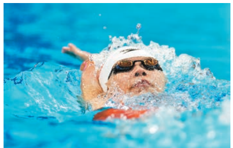
◆中國18歲小將萬樂天在女子100米背泳決賽名列第4。