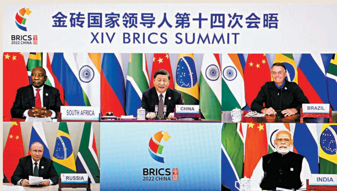
◆ 6月23日晚，國家主席習近平在北京以視頻方式主持金磚國家領導人第十四次會晤並發表題為《構建高質量夥伴關係 開啟金磚合作新征程》的重要講話。南非總統拉馬福薩、巴西總統博索納羅、俄羅斯總統普京、印度總理莫迪出席。 新華社

香港文匯報訊 據新華社報道，國家主席習近平23日晚在北京以視頻方式主持金磚國家領導人第十四次會晤。南非總統拉馬福薩、巴西總統博索納羅、俄羅斯總統普京、印度總理莫迪出席。