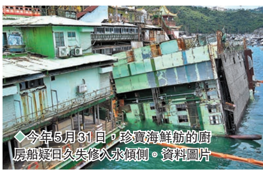
◆今年5月31日，珍寶海鮮舫的廚房船艙日久失修入水傾側。資料圖片

海事處在6月23日表示，收到船東經其代理人所提交的書面報告，獲悉珍寶海鮮舫在6月18日晚上，被遠洋拖船「JAEWON 9」拖航至南中國海西沙群島水域時，因遇上惡劣天氣而傾覆。目前，珍寶海鮮舫和該拖船仍在西沙群島一帶水域海面，船東會繼續跟進處理。