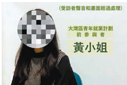
▲黃小姐去年參加「大灣區青年就業計劃」而到廣州工作。

在不打算參加計劃的受訪者中，主因是擔心疫情持續，回港會受阻（53.3%）；香港沒有駐內地的勞工部門，擔心沒有生活支援（43%）；完成計劃後未能繼續在大灣區其他城市工作，浪費之前經驗