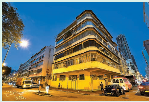
◀▶ 項目涉及30個街號的樓宇，受影響住戶約154伙共540人，涉及9個公務員建屋合作社。

資源，增加資助房屋單位的供應。相對於一般舊樓而言，合作社樓宇重建項目涉及的業權收購工作較為複雜，民建聯衷心感謝各方的努力，讓今次首項獲政府授權進行重建的公務員建屋合作社樓宇得以順利推行。「我們促請有關部門盡最大努力妥善處理合作社樓宇的業權收購和補償事宜，並加大力度，繼續推動更多公務員建屋合作社樓宇的重建計劃。」