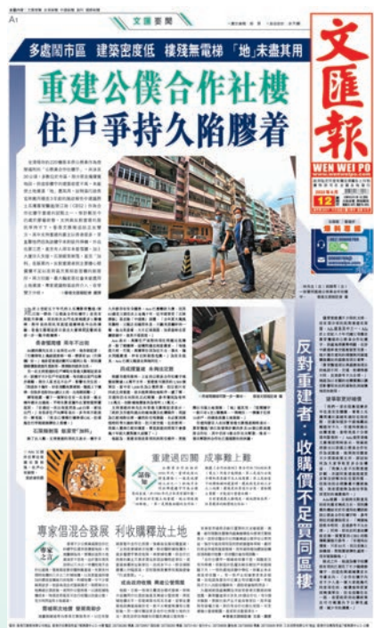
◆香港文匯報5月12日以頭版報道重建公務員合作社樓宇遇到的爭議，並追訪正反雙方的意見。 香港文匯報5月12日版面截圖

今仍未有具體重建時間表，而另一個房委會轄下的馬頭圍邨及房協轄下的樂民新村已屬高齡屋邨，居民均希望房屋署盡快安排重建及作原區安置，故認為市建局應主動與房委會及房協溝通，以小區形式一併規劃重建用地，用盡未用完的地積比，為馬頭圍邨、真善美村及樂民新村居民提供原區安置選項，並在兩個屋邨的原址興建資助房屋，增加房屋供應及完善社區配套。