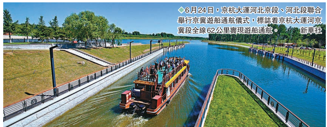
◆6月24日，京杭大運河北京段、河北段聯合舉行京冀遊船通航儀式，標誌着京杭大運河京冀段全線62公里實現遊船通航。 新華社

如今，大運河京冀遊船互聯互通，標誌着京津冀協同發展再次邁出重要一步。在一船遊兩地的基礎上，遠期還將實現京津冀遊船互聯互通。