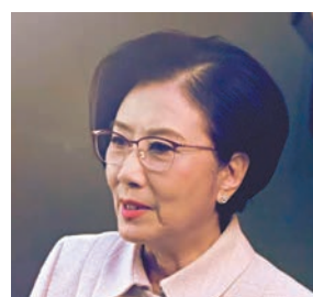
◆汪明荃特別客串演出。

而每個單元劇故事也別具風格與特色，《究竟天有幾高》改編真人真事，一眾主角排除萬難追逐「衝出太空夢想」，帶出只要有決心，香港人沒有做不到的事的信息；《母親的乒乓球》以乒乓球貫穿全劇，帶出關於運動員的勵志感人故事；《我的驕傲》像一部「時光機」，於短短一小時內帶觀眾歷盡回歸祖國25年以來香港的起伏和變遷；《神奇的燈泡》是天馬行空的黑色喜劇，透過狂想曲形式帶出香港人熱心助人的精神；《曙光》主要圍繞食店老闆與太太的創業及愛情故事，二人走過一個又一個時代難關，最終敵不過金融風暴。之後緊接的連續劇《回歸》是《曙光》後傳，主線是食店老闆一家人的故事，當中加有年輕人創業元素，既溫情亦勵志。