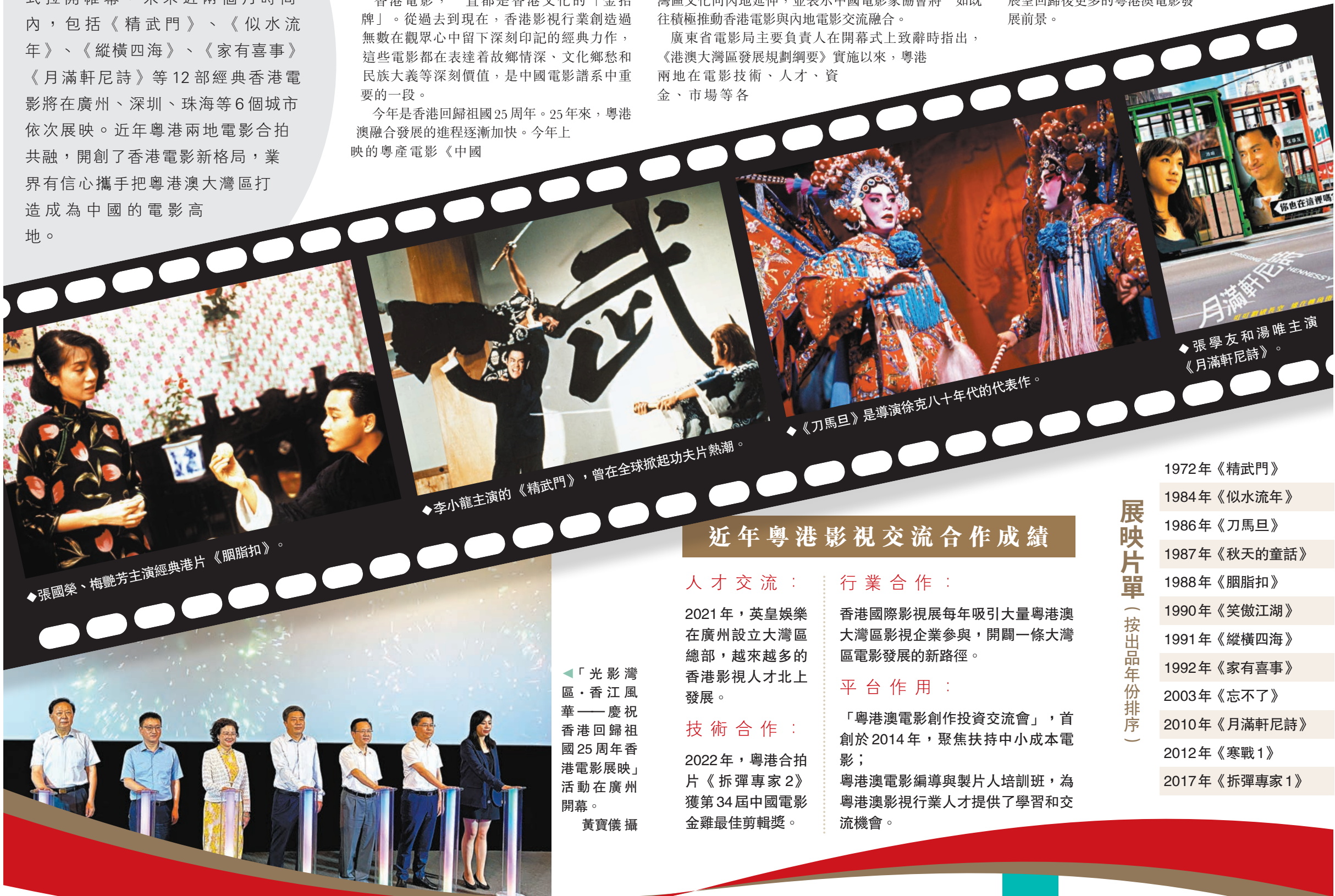
◆張國榮、梅艷芳主演經典港片《胭脂扣》。

「光影灣區·香江風華——慶祝香港回歸祖國25周年香港電影展映」活動由廣東省電影行業協會、廣東省電影家協會、香港電影發展局主辦，旨在從灣區出發，輻射全國，以光影為紐帶，促進人文灣區建設。本次展映活動精選12部香港經典電影，在回顧過往香港電影經典的同時，聚焦回歸後的粵港澳電影合作現狀，展望回歸後更多的粵港澳電影發展前景。