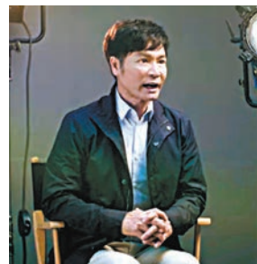
◆郭晉安認為只要腳踏實地，可以去得更遠，做到更好。