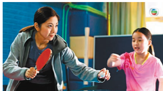
◆《母親的乒乓球》以乒乓球貫穿全劇。