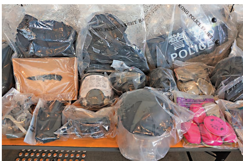
◆警方檢獲盔甲、頭盔、防毒面罩、警裝盾牌及過濾芯等。

叉、軍用匕首和防毒面罩以及過濾器等。警方在其家中搜出盾牌、摺刀、盔甲、頭盔、防毒面罩及過濾器等。 港島總區重案組在北角拘捕另一名22歲男子，涉嫌在網上社交平台煽動其他人參與非法集結，並售賣防毒面具及濾罐。警方在其住所檢獲7個頭盔，28個防毒面具及68個防毒濾罐。 警方表示，「意圖造成身體嚴重傷害」罪，一經定罪最高可被判終生監禁；藏有工具可作非法用途最高可被判監2年；違反《武器條例》及《進出口條例》最高可被判監3至7年。 被捕的3人，除涉嫌干犯以上罪行，亦可能違