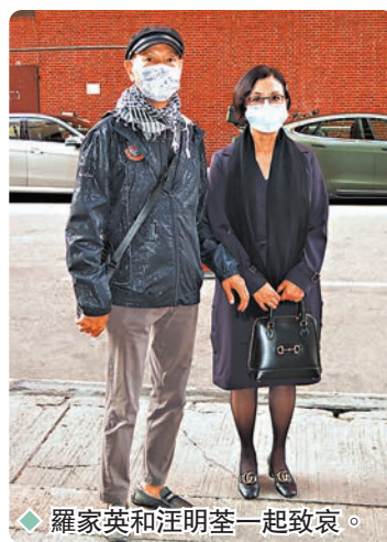
◆羅家英和汪明荃一起致哀。

香港文匯報訊(記者 阿祖)粵劇名伶任冰兒(細女姐)上月於家中安詳離世, 享年 91 歲。任冰兒為已故粵劇名伶任劍輝的堂妹, 一生於粵劇藝壇超過半世紀, 更參與過 197 部電影的演出。任冰兒喪禮昨日舉行, 於世界殯儀館設靈, 以佛教儀式及粵劇界最高榮譽進行, 昨前來致祭的粵劇伶人包括阮兆輝、龍貫天、謝雪心、尹飛燕與兒子阮德鏞一家三口、羅家英、汪明荃、蓋鳴暉及陳鴻進。今早公祭後靈柩運往歌連臣角火葬場火化。