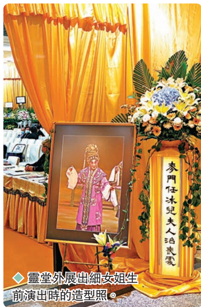
◆靈堂外展出細女姐生前演出時的造型照。