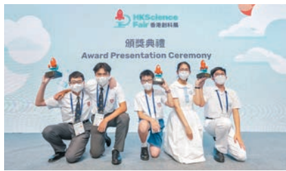
◆保良局馮晴紀念小學(智能水箱+)、保良局李城璧中學(Inno-Beehive)及香島中學(食品鉀濃度降低裝置)分別勇奪「小學組」、「初中組」及「高中組」的金獎。