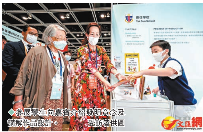
◆參展學生向嘉賓介紹發明意念及講解作品設計。

香港文匯報訊(記者 高鈺)香港創新基金於6月25及26日在香港會議展覽中心舉行首屆香港創科展，以「大想頭齊創新」為主題，匯聚120隊中小學創科生力軍，向公眾展示他們的創意及研發成果。創科展昨日舉行頒獎典禮並公布十支獲獎隊伍，在香港特區行政長官林鄭月娥、創新及科技局局長薛永恒、香港創科展評審委員林家禮及香港科技大學校長史維、香港創新基金主席黃永光及副主席黃敏華等嘉賓的支持下，見證年輕人發揮創意及科研精神，期待他們為個人發展和香港的未來開創新篇。