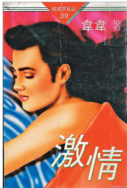
◆韋韋小說雖香艷而不太淫。作者供圖

夜來酷熱，冷氣機不靈，醒來覺感暑氣；半躺在床上，昏昏沉沉，周身乏力。隨手拿起床邊一書，翻了翻，人突然精神了，一看書名，韋韋的《威威李私記》是也。這是一部老年的書了。記得是在舊書店買的。韋韋是誰？乃上世紀六十年代大大有名的通俗小說家依達也。依達當年風靡了不少新一代的青年。其後可能為了稻粱謀，用韋韋這筆名寫了不少艷情小說。《威威李私記》就像楊天成的《二世祖手記》，寫了一集又一集，我那本已是第七集。如非銷得，那怎會不斷出爐？令我精神突振的是這段：台下幾個女人要威威李唱歌，唱粵曲。威威李猛推搪，有女人在叫：「唱兩句都得！」威威李無可奈何，拿起咪高峰，高歌：「落番半邊百葉窗，與嬌共睡在床上……」這是演繹自粵劇《帝女花》的曲詞，在上世紀七八十年代，不少人會唱。看到這裏有感，只因想起當年有位鼎鼎有名的報人，曾