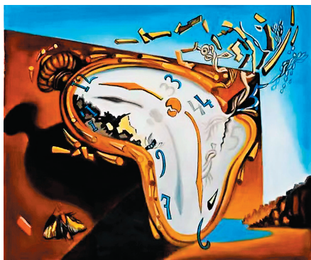
◆薩爾瓦多·達利的時間意象。

為，有時什麼都不做，反而有更好的結果。人生如舞台，一場戲接著一場戲，一個角色接著一個角色。一身戲服，一段人生。脫下戲服，便回歸自我。要樂於嘗試新事物，不以舊經驗量度新環境，而以新環境昇華舊經驗。比如飲酒，你只喝醬香型，就失去了品嚐清香型、濃香型的機會；比如閱讀，你只看小說，就感受不到散文、詩詞的韻味；比如交往，你只選擇某一團體，就難以理解社會的豐富多彩。時間帶來新意，在於柳暗花明。每個人在生活中都會遇到一些坎，當時會覺得真過不去，結果都過了。山窮水盡，很多時候只是我們的想像；急於求成，是產生想像的原因。擯棄妄念，遇事不衝動，不呈一時之快，三思而後行，讓事情沉澱、情緒冷靜後才採取措施，你會發現情況並沒有那麼糟糕。相信驚喜的存在，對未來永遠抱有好奇心，生活在希望之中。戶外遠足運動作為對城市生活的叛逆，近年來越來越受人歡迎。登高入幽，上岩下溪，峰迴路轉，似乎總有新奇藏在前面，揭示了遠足運動的真正魅力：不單有美好的自然風光，更有對美好風光的期待。轉過彎，或許就是一片新天地在等著你。時間帶來新意，在於日積月累。人生之路千條萬條，但萬變不離其宗，每個人的日子都是自己過出來的。財富有多有少，地位有高低，這是客觀存在，卻不是量度幸福的標尺。不管身居何處，只要沿着自己選擇的方向和認定的方法，一天一天做下去，件件椿樁，點點滴滴，從量變達到質變，就會收穫一個完全不一樣的自己。行為養成習慣，習慣成就性格，性格決定命運。思想的頓悟，是在長期的修行中不經意出現的；健碩的體魄，反映了良好的生活習慣和運動規律；理想的生活狀態，蘊藏着你過往的所有付出。時間帶來新意，在於周而復始。雖然說