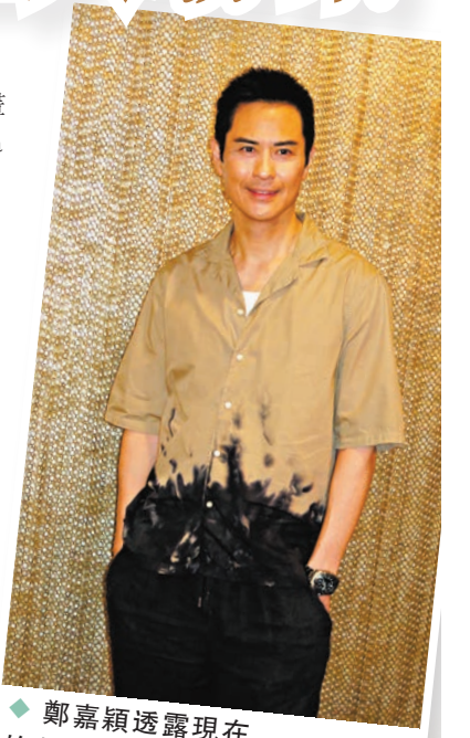
◆ 鄭嘉穎透露現在的生活就是工作、打波、放遙控車及照顧家庭。