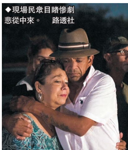
◆現場民眾目睹慘劇悲從中來。