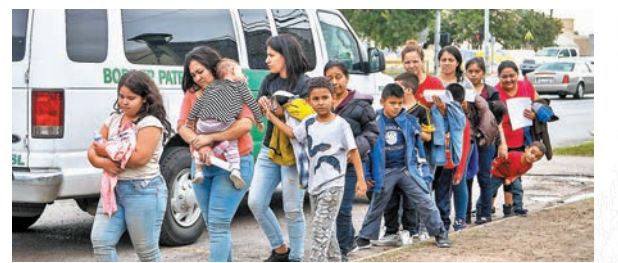
◆美國一刀切地驅逐在邊境尋求庇護者的政策，極大地傷害兒童權利。資料圖片