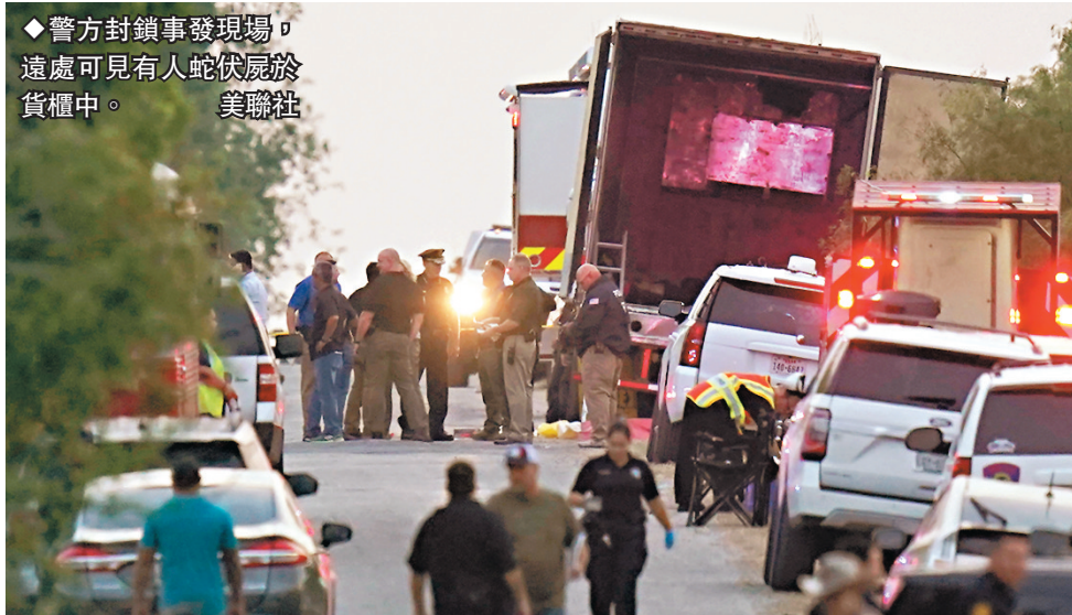
◆警方封鎖事發現場，遠處可見有人蛇伏屍於貨櫃中。