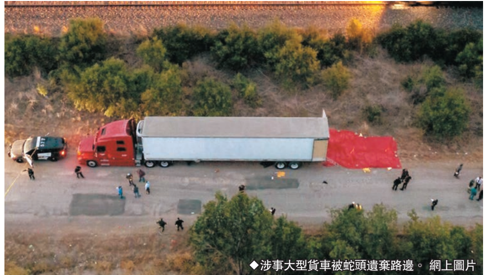
◆涉事大型貨車被蛇頭遺棄路邊。

美國南部邊境難民和移民的人道狀況持續受到國際社會關注，得州聖安東尼奧前日便發生一宗人間慘劇，一輛被人蛇集團用作偷渡的貨車懷疑遭蛇頭遺棄，數十名人蛇於攝氏近40度高溫下被困於貨櫃中，導致最少50人死亡，16人嚴重中暑送院，包括4名未成年人。今次是美國歷來最嚴重的人蛇死亡事件，當局事後拘捕3名疑犯，但未知他們與事件有何關係。