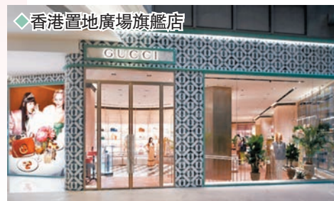
◆香港置地廣場旗艦店

日前，全新 GUCCI 置地廣場旗艦店銳意帶來更昇華的購物體驗，店舖樓高兩層，網羅男女裝服裝、行李袋、手袋、鞋履、腕錶及珠寶、家飾、生活風尚用品及香氛，新裝演帶來舒適感，賞心悅目的大理石外牆加裝 LED 顯示板，可播放 3D 立體效果的動態影像。店舖設計將新舊融合，糅合工業風與浪漫風，呼應品牌全新系列不拘一格的優雅時尚格調，同時亦提供 Gucci DIY (Do It Yourself) 定製服務，可為指定產品塑造個人化設計，鼓勵顧客透過親自挑選物料、色調及細節，詮釋品牌美學。為配合開幕，旗艦店更推出 Love Parade 獨家精選系列、珍稀皮革縫製的 Beloved 系列限量版手袋、珠寶及 Decor 系列等。