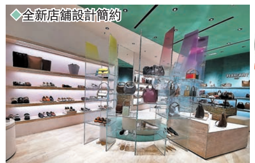
◆全新店舖設計簡約 ◆全新 TERRY 系列

風中舞動的繁花、嬌陽照耀的綠茵，透過多個時尚品牌的精湛設計及巧手匠心，為活潑好動的你散發夏日活力色彩，為今季增添許多亮麗驚喜。當中，不少品牌特地在香港開設新店及期間限定店，展示其一系列全新獨特時裝及手袋款式，亦有品牌更特地推出客製化系列，讓大家為自己塑造個人化設計，其巧妙設計，靈活多變，展現不同的理想都市女性造型，充滿時尚活力。