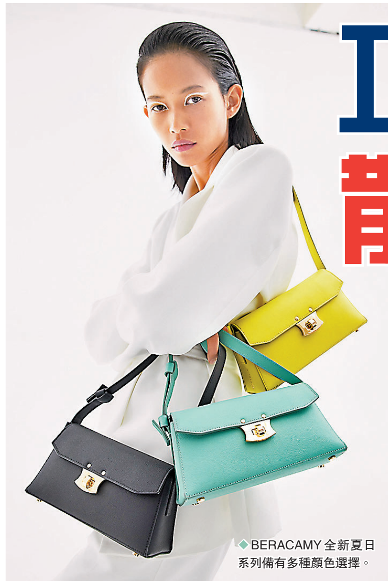
◆BERACAMY 全新夏日系列備有各種顏色選擇。