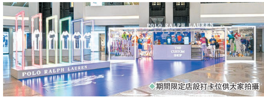
◆期間限定店設打卡位供大家拍攝