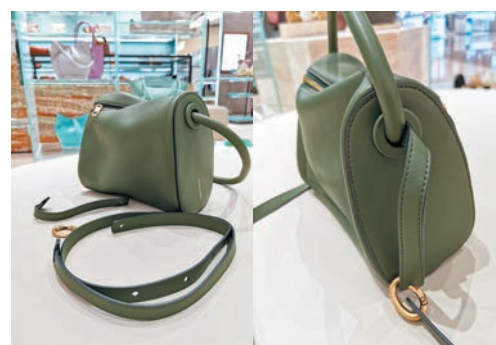
◆肩帶設計 ◆側看肩帶位置

品牌今年在香港再添兩間新店，延續品牌簡約利落的時尚精神，兩店以綠、杏雙色為主調，一邊牆面貼上綠色絲絨，一邊則鋪上杏色石材，既簡約又典雅；純色圓形的產品展示台，對比不規則紋理的方形石製陳列櫃，展現產品精巧時尚的風格；七彩繽紛的玻璃陳列架，傍邊是大直鏡，驟現一種獨特的透視感，給予客人雅緻舒適的購物空間。