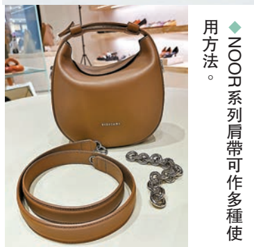
◆NOOR 系列肩帶可作多種使用方法。

今季的颜色選擇如同調色盤般豐富，充滿活力，如焦紅色、瀝青灰色、杏仁奶白、檸檬黃、湖水藍、草綠、暖棕褐色、焦糖啡，以至永恒經典的黑色等，互相交錯，綻放光彩。全新系列包羅了 NOOR、TERRY、ZHARIKA 及 ELLANA 等，如充滿流暢曲線美的摺疊袋身，以皮革扣把手袋與肩帶連成一體，功藝細節貫穿設計，把品牌的美學發揮得淋漓盡致，輕盈時尚的手挽，可讓袋子成為單肩袋、斜背袋或手拿包，靈活多變。NOOR 手袋更可打開安全磁石上蓋，有如綻放的花朵，手挽上的皮革扣，只要推前拉下便可輕鬆調節長度。