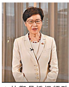
▲林鄭月娥視頻致辭。 視頻截圖