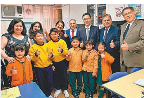
◆圖為楊潤雄疫情前探訪學生情況。

香港文匯報訊(記者 姜嘉軒) 特區政府換屆在即，現屆政府教育局局長楊潤雄日前獲任命為新一屆政府的文化體育及旅遊局局長。他昨日於Fb總結過去十年的教育局工作生涯時表示，過去數年得到各界的支持，做了大量撥亂反正、正本清源的工作，為師生提供一個安全及安靜的教學環境，為國家及香港培育愛國愛港、有為上進的人才。離任教育局局長在即，楊潤雄直言心裏難免不捨，但認為「教育」和「文體旅」之間有着不少互聯互通的地方，未來還有很多機會交流合作。