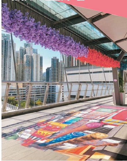
◆花海與3D地畫融為一體