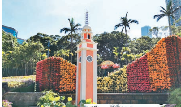
◆九龍公園的「璀璨香江 同慶回歸」