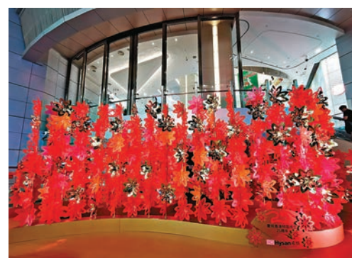
◆「和昌盛華利園花開」藝術作品