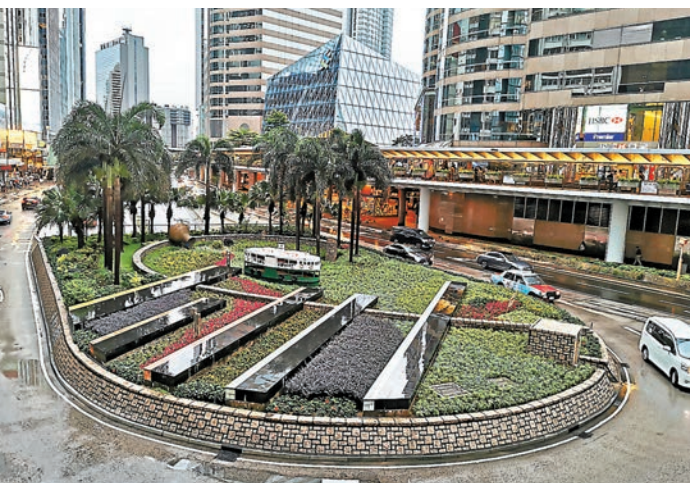
◆中環路旁的綠化園地

另外，如想跟花花花牆合照打卡，大家不妨到中西區海濱長廊（中環段）、九龍公園、荔枝角公園、大埔海濱公園、屯門文娛廣場和達東路花園，這兒大家可以欣賞色彩繽紛的園林景點和造型優美的花藝擺設，感受慶回歸的熱烈氣氛。例如，在中西區海濱長廊（中環段）設置的「魅力都會」垂直花牆，花牆以翠巒及摩天大廈的城市天際線為背