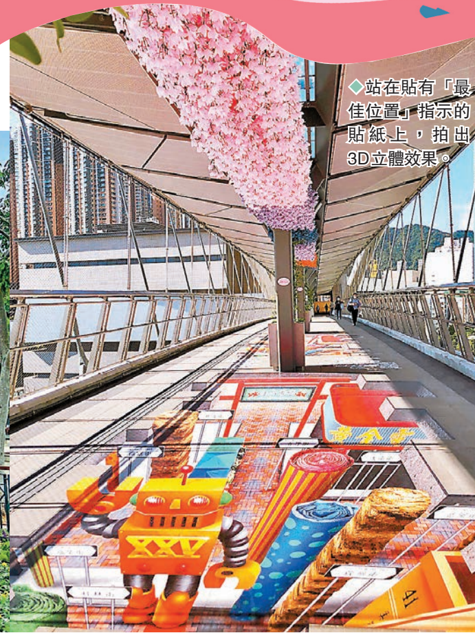
◆站在貼有「最佳位置」指示的貼紙上，拍出3D立體效果。