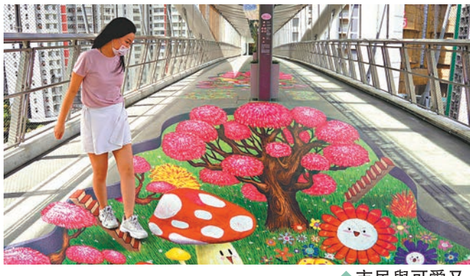
◆市民與可愛又像真的3D錯視藝術地畫合影