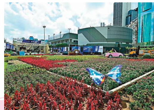
◆海底隧道灣仔入口旁的主題園圃「團聚、同行」