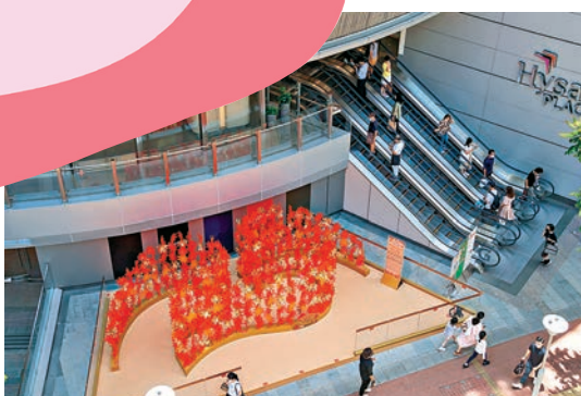
◆展品從高處觀看可見充滿動感的「25」線條