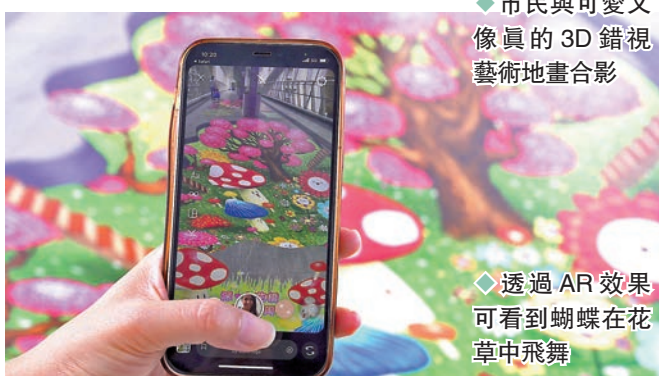
◆透過AR效果可看到蝴蝶在花草中飛舞