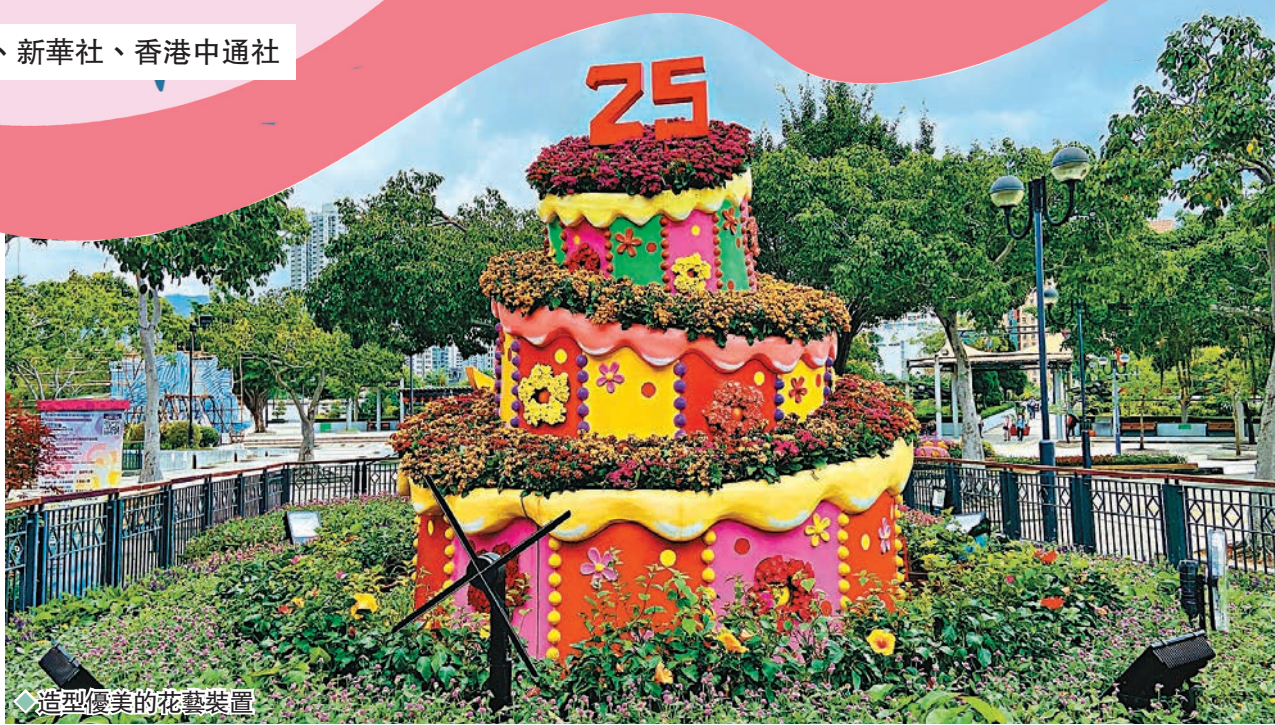
造型優美的花藝裝置