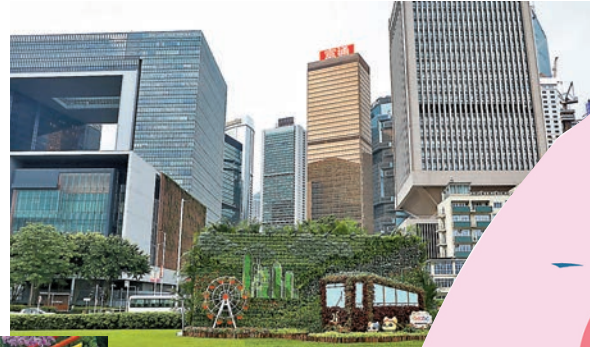
◆「魅力都會」垂直花牆