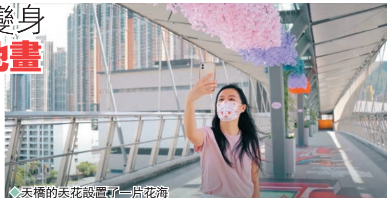
◆天橋的天花設置了一片花海

同時，天橋地面還精心設計了兩款3D錯視藝術地畫，第一款是以花海為天，青草為地為藍本，由香港插畫