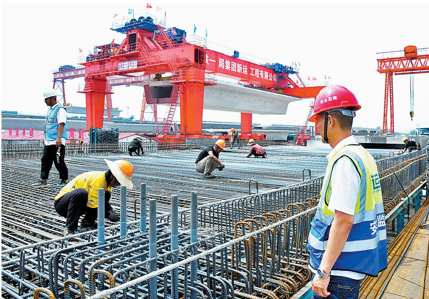
◆國家統計局公布數據顯示，6月內地製造業採購經理指數（PMI）和非製造業商務活動指數（非製造業PMI）分別回升至50.2%和54.7%，雙重回榮枯線以上。圖為6月30日，在山東煙台市蓬萊區濰煙高鐵製架樑場，工人在生產預製箱樑構件。新華社

相比製造業，服務業在更低的景氣水平基礎上反彈幅度更大，6月商務活動指數回升7.2個百分點至54.3%，重返擴張區間。