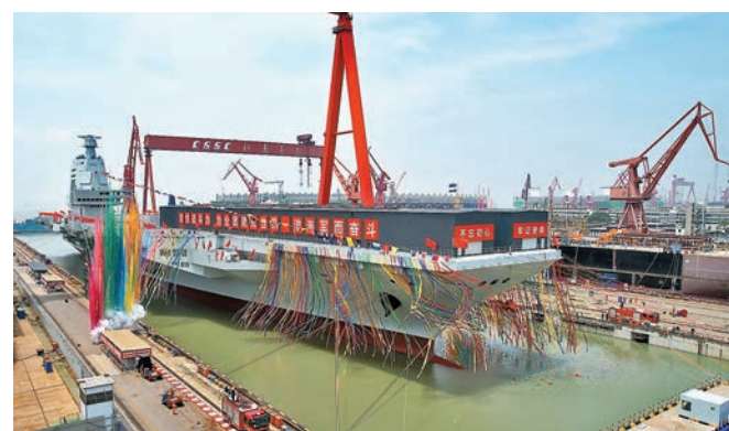
◆福建艦是中國完全自主設計建造的首艘彈射型航空母艦。圖為6月17日福建艦下水。

有記者問，據外媒報道，美網司令司兼國家安全局局長近日承認，美國向烏克蘭派遣過「進攻性」的網絡部隊，並對俄羅斯發起過網絡攻擊。另據美《陸軍時報》報道，美陸軍網絡和