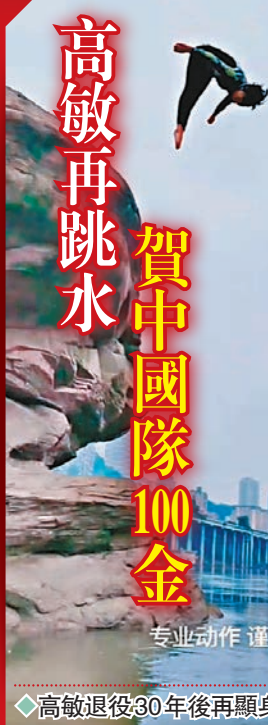
高敏再跳水 賀中國隊100金 專業動作 謹慎模仿 ◆高敏退役30年後再顯身手，慶祝中國隊奪第100金。

香港文匯報訊（記者 陳曉莉）香港時間29日，全紅嬋和白鈺鳴在游泳世錦賽跳水比賽奪得混合全能金牌，為中國跳水隊達成世錦賽100金里程碑。賽後，為中國跳水奪得史上首枚世錦賽金牌的「跳水女皇」高敏，在個人社交平台晒出自己在江邊跳水的視頻，慶祝中國隊收穫100金。