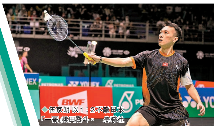
◆伍家朗以1：2不敵日本「一哥」桃田賢斗。

至於兩位男單港將，伍家朗以21：11、8：21、18：21不敵日本「一哥」桃田賢斗；李卓耀以21：15、6：21、13：21憾負東奧冠軍安賽龍（丹麥），未能再進一步。