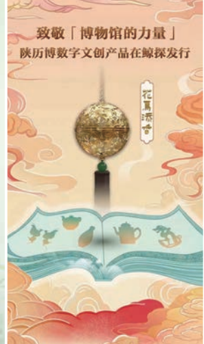
◆ 第一款「花舞大唐」IP主題數字文創之「花鳥添香」成功發售。

隨著消費者代際更迭，陝西歷史博物館不斷創作體驗消費場景，擁抱年輕消費群體。聯合社會企業，基於文物藏品數字化信息二次創作的海量數字化成果以NFT產品為載體相繼面世；以數字虛擬人為代言的虛擬IP也將進入公眾的視野，文創產品直播帶貨、文物藏品闡釋傳播、文博動態信息傳送都可以由虛擬人的身份與角色帶入甚至主導；圖片、二維動畫、三維動畫等所承載的海量創意設計將成為驅動IP授權的新動能。