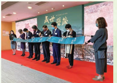
◆ 「唐代壁畫文化特展走進港澳校園活動」香港展開幕式。

陝西與香港文博系統交流合作由來已久。早在1978年，陝西文物就隨《中華人民共和國出土文物展》在香港首次亮相，受到香港市民的極大關注。此後，香港與陝西的文化交流合作穩步推進，文物交流展相繼在對方展出。截至目前，陝西文物共計在香港展出11次，香港文物在陝西展出3次。未來，兩地將有更多更深層的交流。