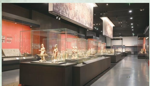
◆ 陝西古代文明展廳。

在漫長的歷史進程中，中華民族筚路藍縷，以自強不息的決心和意志，跋山涉水，走過了不同於世界其他文明的發展歷程。中華文明自古就以開放包容聞名於世，在同其他文明的交流互鑒中不斷煥發新的生命力。面向未來，陝