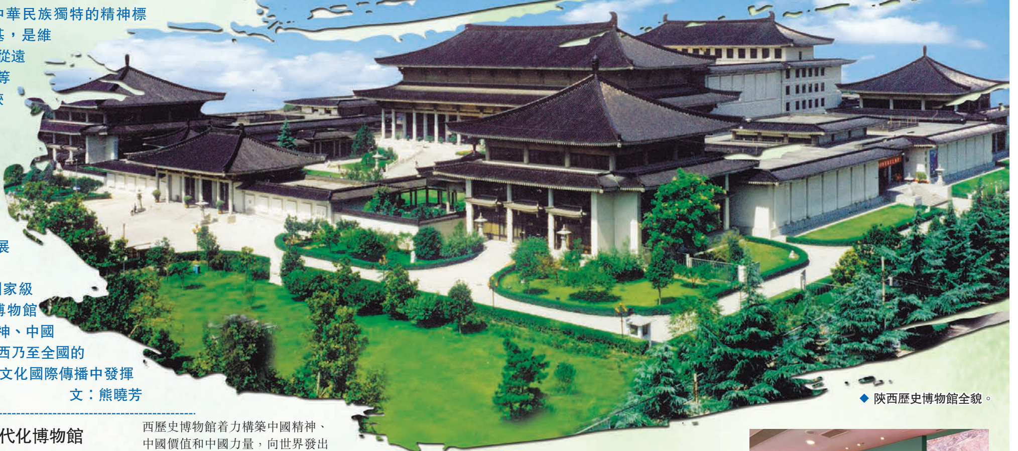
◆ 陝西歷史博物館全貌。