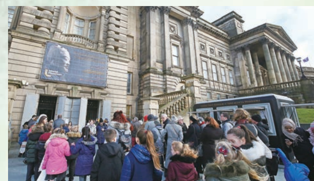
◆ 2018年在英國利物浦國家博物館舉辦《秦始皇與兵馬俑》展，觀眾排起了長龍。

陝西歷史博物館不僅是陝西的文化名片，也是中國歷史文化的重要標識，它通過策劃展覽促進文化交流的方式，代表中國走進東亞、走進歐洲、走進美洲，中華文化國際傳播的陝西擔當便拉開序幕。陝西文物出國（境）展覽，以周代青銅器、秦代兵馬俑、漢風漢宇、唐代金銀器、絲綢之路交流、佛教造像、陝西三秦瑰寶等七大類為標誌性文物特色展覽。同時，陝西歷史博物館積極促進與國際博物館的交流，目前已與韓國、澳大利亞、新西蘭、日本、匈牙利、英國、美國、意大利、哈薩克斯坦等國家的博物館建立友好關係，與兄弟單位共同發起成立的「一帶一路」沿線國家博物館聯盟，其成員已達30多家博物館，在文物保護、壁畫修復、人員交流、展覽互動、創意產業發展等領域進行了一系列合作。