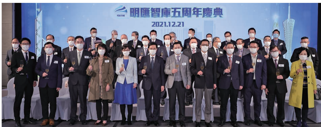
◆ 李家超（前排左六）應曾智明主席（前排右六）邀請，出席明匯智庫五周年慶典並致辭，讚揚明匯智庫建言獻策，支持政府依法施政。

長達三個多小時的專訪，曾智明談家國談香江，談民生談教育，談青年談抱負，處處體現了他的拳拳愛國心和濃濃赤子情，體現了他的履職盡責和使命擔當，無不令人敬佩令人動容。