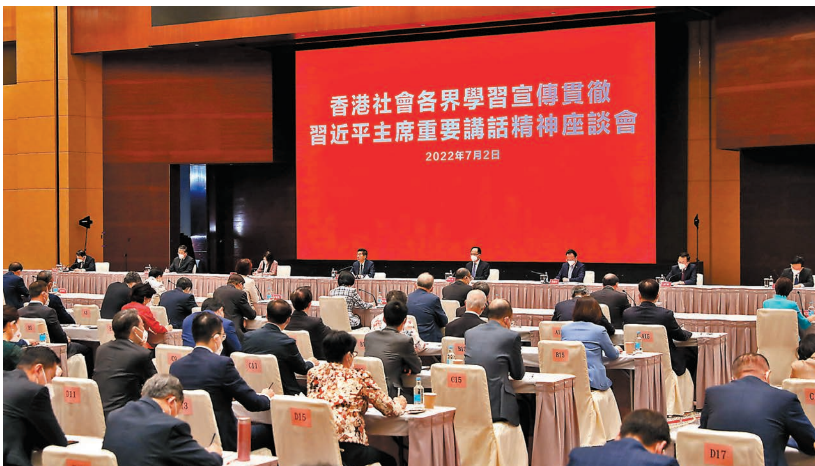
◆7月2日上午，中央政府駐港聯絡辦舉辦香港社會各界學習宣傳貫徹習近平主席重要講話精神座談會。