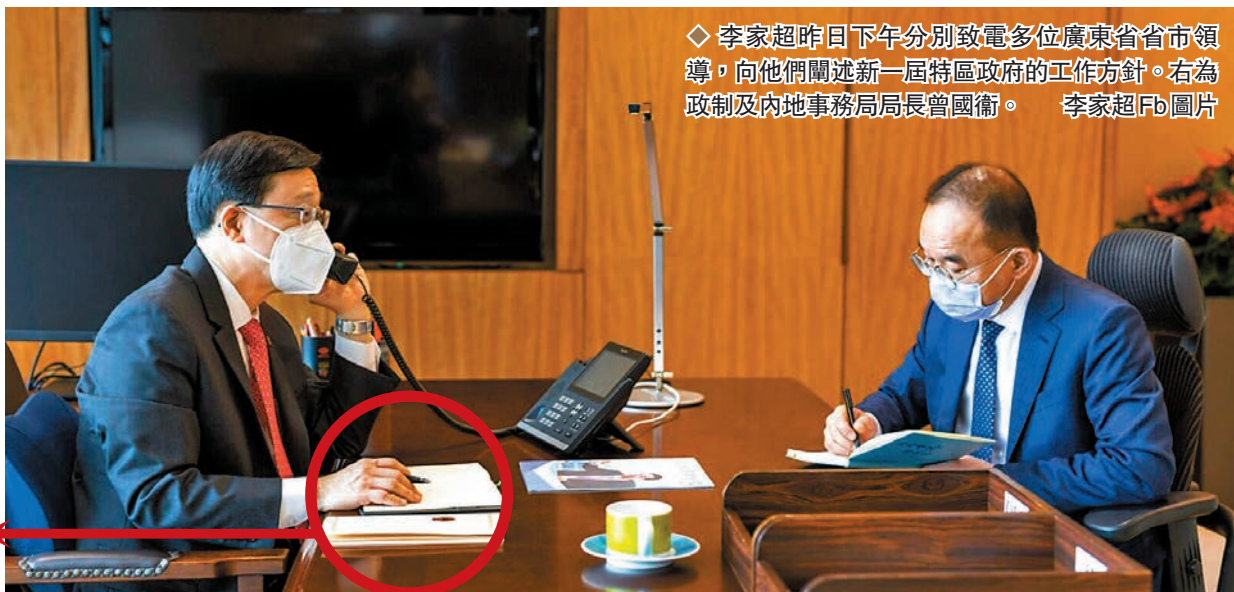
◆李家超昨日下午分別致電多位廣東省省市領導，向他們闡述新一屆特區政府的工作方針。右為政制及內地事務局局長曾國衛。