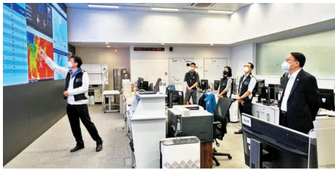
◆陳國基前晚到緊急監援中心視察，聽取同事匯報「暹芭」的最新情況和中心的全面部署。

他表示：「緊急監援中心會繼續發揮專業高效的精神，保障市民生命財產、確保市面安全有序運作。對於各位當值同事、其他同樣在惡