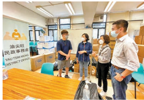
◆麥美娟到設於梁顯利油麻地社區中心的臨時庇護中心視察。