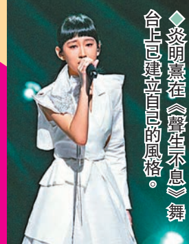
◆炎明熹在《聲生不息》舞台上展現自己的風格。

(記者 胡若璋 廣州報道) 7月1日，為祝福香港回歸祖國25周年，由香港大公文匯傳媒集團、TVB、能量悅動音樂聯合出品，炎明熹(Gigi)演唱的原創歌曲《最牽掛的》一經上線，便獲得廣大網友的熱讚：「好有大時代的氣息」。據悉，歌曲及MV上線兩日在網絡平台總播放量輕鬆超越500萬次。