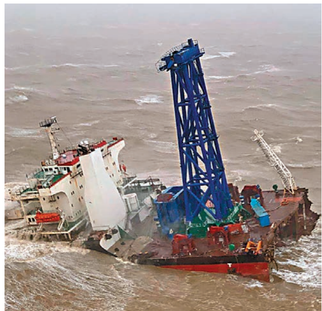
◆失事內地工程船幾近完全沉沒。

據直升機的攝影機拍攝到的情況顯示，當時工程船已斷開兩截，大部分船身已下沉，有船員在露出水面的甲板上待援，情況十分危急。飛行服務隊空勤主任冒著風浪由直升機游繩空降甲板，將3名船員吊上直升機，送往北大嶼山醫院救治，他們只受輕微撞傷或擦傷。據獲救船員向救援人員透露，船身嚴重傾側及斷裂後，他們只能抓緊船上圍欄待救，而其他船員在首架直升機到場前已不見蹤影。