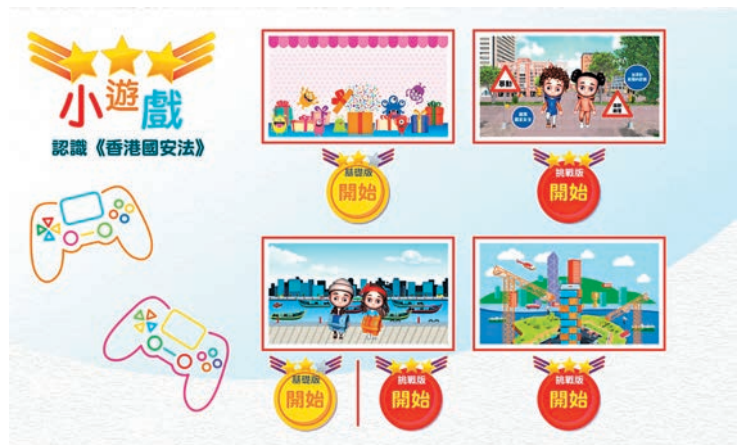
◆瀏覽人士可透過最新小遊戲，評估自己對《香港國安法》的認識。

香港文匯報訊 適逢香港國安法實施兩周年，保安局昨日七月二日更新香港國安法網上虛擬展覽的內容，令展覽內容更為豐富，並提高趣味性。經更新的香港國安法網上虛擬展覽，除提供更豐富展覽內容外，並推出一款小遊戲，讓青少年能夠通過生動有趣的方式，測試自己對香港國安法的認識。在更新展覽中，保安局又特別展出名為《我們的國家，我們的安全》的國安教育繪本節錄，讓青少年能以深入淺出而具趣味性的方式，提升對總體國家安全觀和香港國安法的了解。保安局稍後會於展覽中展示「二〇二二年國家安全齊參與」計劃中，標語創作暨海報設計比賽的得獎作品，以表揚得獎同學。該計劃由保安局和教育局攜手推展，旨在推動全校師生共同參與，讓國家安全教育植根校園，茁壯成長。市民可瀏覽虛擬展覽的網站 nslexhibition.hk，360度全方位了解香港國安法，認識維護國家安全和守法的重要。