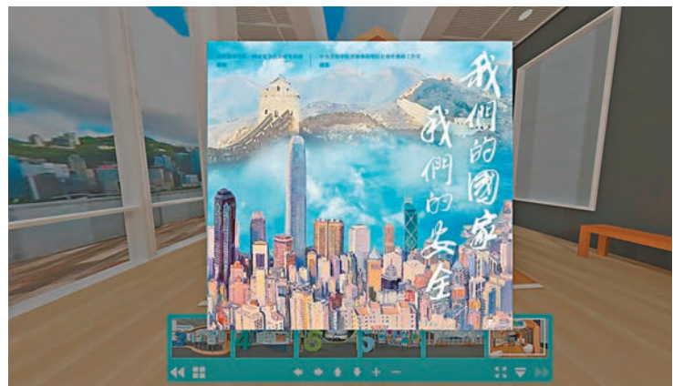
◆虛擬展覽上載了名為《我們的國家，我們的安全》的國安教育繪本。

香港文匯報訊 適逢香港國安法實施兩周年，保安局昨日七月二日更新香港國安法網上虛擬展覽的內容，令展覽內容更為豐富，並提高趣味性。經更新的香港國安法網上虛擬展覽，除提供更豐富展覽內容外，並推出一款小遊戲，讓青少年能夠通過生動有趣的方式，測試自己對香港國安法的認識。在更新展覽中，保安局又特別展出名為《我們的國家，我們的安全》的國安教育繪本節錄，讓青少年能以深入淺出而具趣味性的方式，提升對總體國家安全觀和香港國安法的了解。保安局稍後會於展覽中展示「二〇二二年國家安全齊參與」計劃中，標語創作暨海報設計比賽的得獎作品，以表揚得獎同學。該計劃由保安局和教育局攜手推展，旨在推動全校師生共同參與，讓國家安全教育植根校園，茁壯成長。市民可瀏覽虛擬展覽的網站 nslexhibition.hk，360度全方位了解香港國安法，認識維護國家安全和守法的重要。