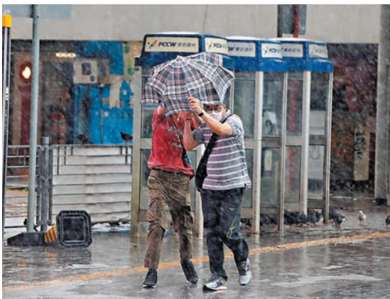
▲颱風「暹芭」襲港，昨日冒着風雨出街市民也狼狽不堪。

乘10呎的招牌帆布被吹脫搖搖欲墜；中環堅道有大廈外牆一幅約10米乘8米棚架上午7時半被吹歪，大量竹枝墜地；半山雅寶利道有20米大樹塌下壓中一輛的士；山頂貝璐道7號近永安邨及元朗牛潭尾清攸路亦有10米大樹被吹倒；警方在八鄉錦上路發現一棵直徑約50厘米、4米高大樹倒塌在迴旋處路中心，即迅速使用工具移除。