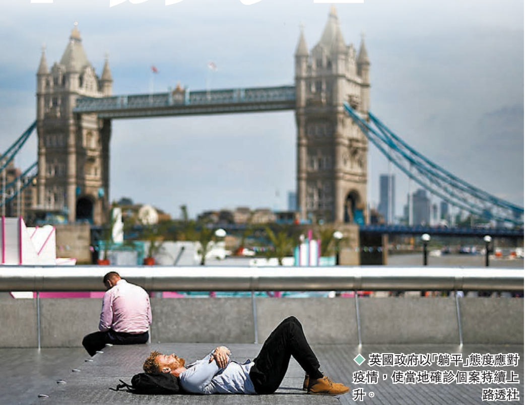
◆ 英國政府以「躺平」態度應對疫情,使當地確診個案持續上升。

ONS 隨機從家庭住戶進行病毒檢測,從而估算社區感染個案數目,在截至上月25日的一周內,英格蘭和蘇格蘭分別新增183萬和28萬宗確診個案,英格蘭平均每30人便有1人染疫,陽性比率為3.35%。由於前年夏季的陽性比率一直維持在0.1%以下,至於去年夏季比率最高為1.57%,反映今夏疫情明顯嚴重得多。