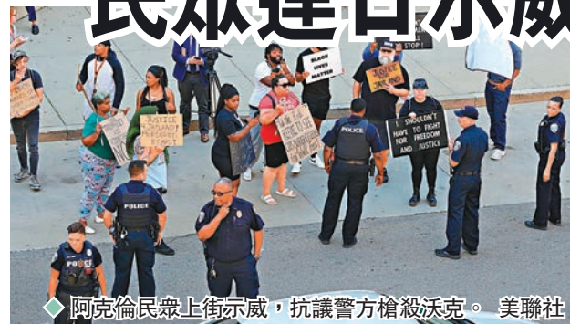
◆ 阿克倫民眾上街示威,抗議警方槍殺沃克。

美國俄亥俄州東部城市阿克倫上週發生警員槍殺黑人事件,一名黑人遭警員連開90多槍,最終身中60槍死亡。事件引發當地居民怒火,連日發起抗議示威,怒斥事件是「屠殺」。鑑於當地局勢緊張,市長決定取消當地的國慶慶祝活動。