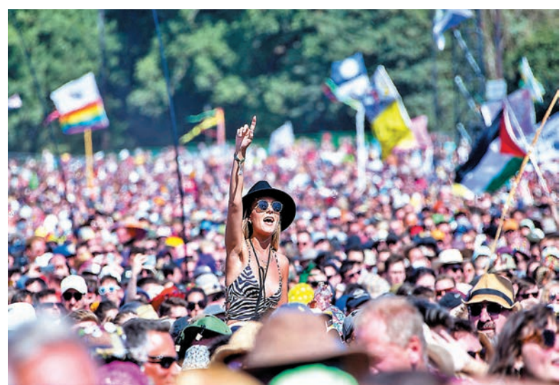
◆ 格拉斯頓伯里音樂節觀眾均沒有保持社交距離。

英國國家統計局(ONS)的最新數據顯示,在截至上月25日的一周內,當地新增約230萬新冠確診個案,較前一周大增32%,新增病例數目不但是自4月底以來最高,亦是疫情爆發以來夏季月份中最高,主要由變種病毒Omicron的亞變種BA.4和BA.5引起,住院人數亦出現上升趨勢。英媒指出,當地今夏的疫情較過去兩年嚴峻,政府或需反思現行的防疫方針,收緊防疫措施。