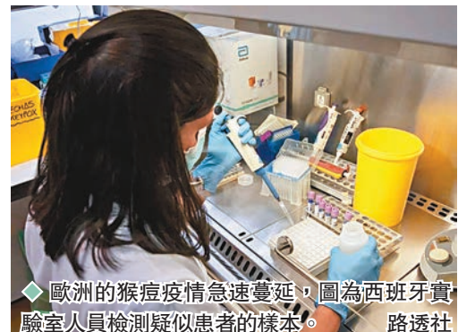
◆ 歐洲的猴痘疫情急速蔓延,圖為西班牙實驗室人員檢測疑似患者的樣本。