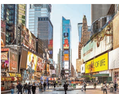
◆ 時代廣場等敏感場所將禁止民眾攜槍進入。